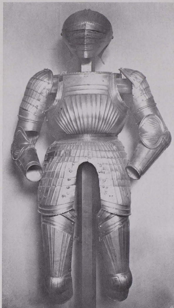
Fig. 387. Teile eines geriffelten Feldharnisches, deutsch, um 1500 (S. 299)