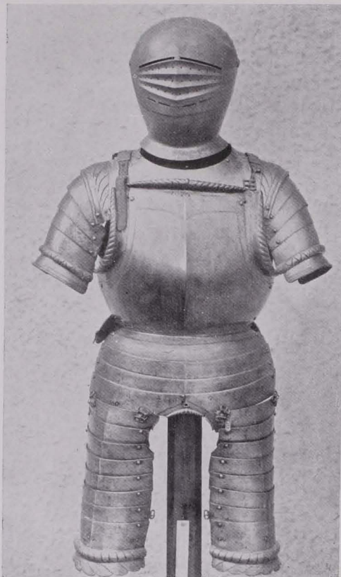
Fig. 388 Teile einer blanken Rüstung, Nürnberg, um 1550 (S. 299)