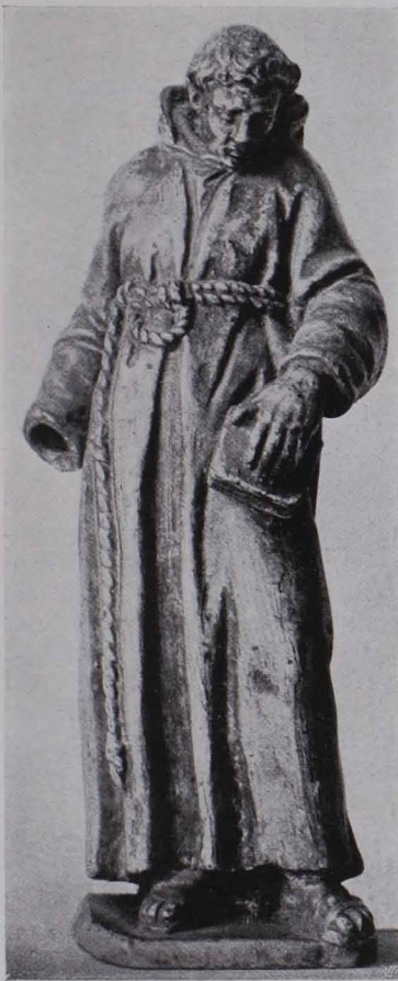
Fig. 315 Mönchsfigur, Zinnfuß (S. 240)