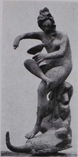
Fig. 314 Detail vom Aktäonsbrunnen Fig. 313 (S. 240)

6. Relief aus vergoldetem Kupferblech; 17 x 27 cm; oben halbrund geschlossen, die zurücktretenden Zwickeln eine Tapete imitierend. Das Bildfeld wird durch ein Postament zweigeteilt, auf dem (vor Säulenarchitektur, Vorhang, Fenster mit Durchblick in Landschaft) Maria mit dem Kind, der hl. Josef und der kleine Johannes mit dem Lamm sitzen. Unten steht vor diesem Postament der hl. Antonius Abbas mit Rosenkranz, Stock und