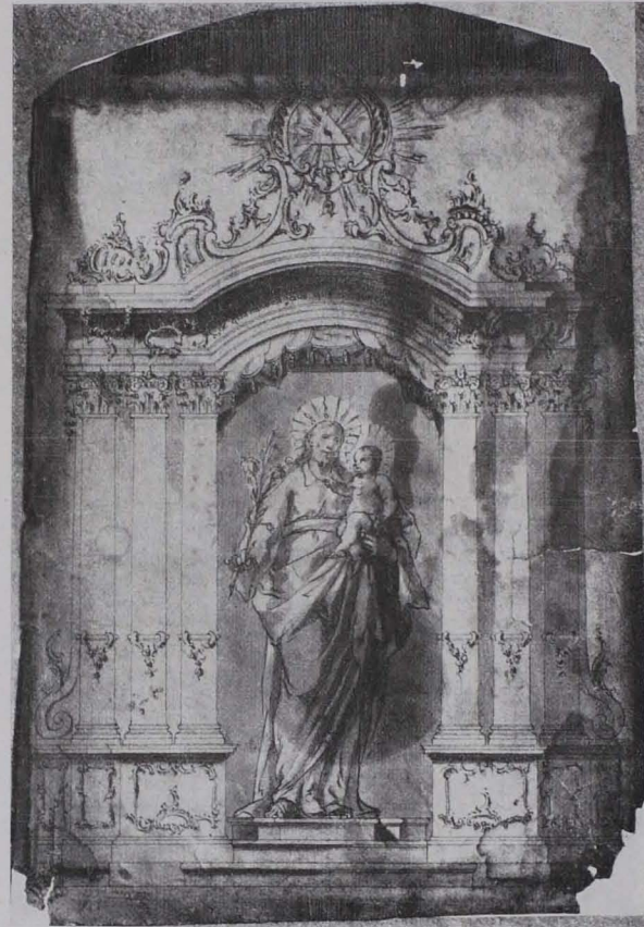
Fig. 251 Altarentwurf von Wolfgang Hagenauer (S. 198)