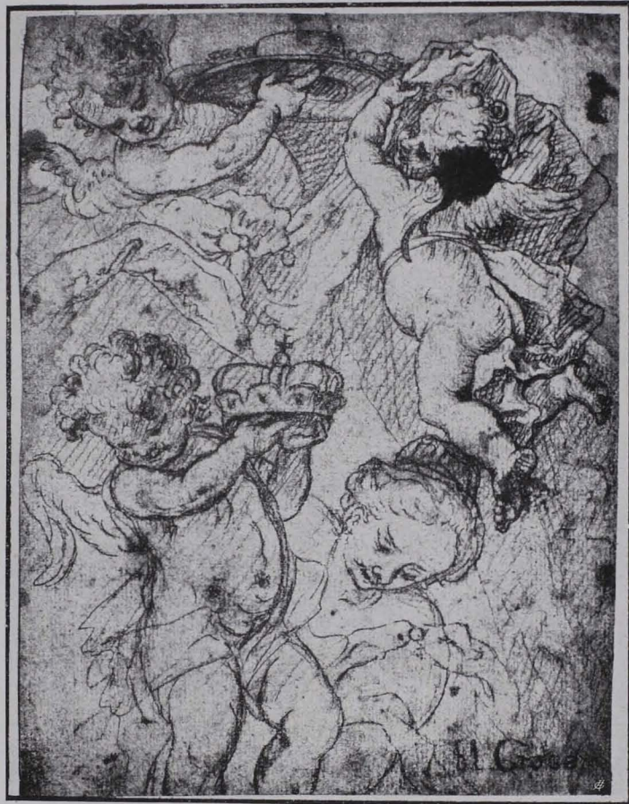
Fig. 238 Rötel- und Federskizze von J. N. della Croce (S. 165)

krönt, im Inschriftfeld: Reverendissimo . . . Dno Coelestino Ord. S. P. Benedicti . . . monasterii ad S. S. Udalricum et Ajram Augustae Vindelicorum Abbati vigilantissimo . . . nec non . . . Principis et Archi Epi. Salisburgen. consiliario . . . leve hoc manuum suarum ad hortorum condecorationem spectans opusculum . . . . F. Ant. Danreiter.