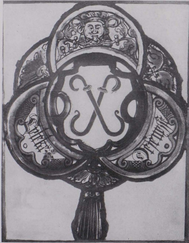
Fig. 112 Wappenscheibe (Speisezimmer Nr. 28), Sammlung Hofrat v. Plason (S. 80)