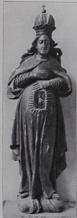
Fig. 102 Adventmaria, Sammlung Orthofer (S. 71)

5. Zirka 45 cm hoch. Hl. Anna selbdritt, sitzend, die beiden Kinder auf den Knien haltend, Maria in einem Buche blättern. Salzburgisch. Anfang des XVI. Jhs.