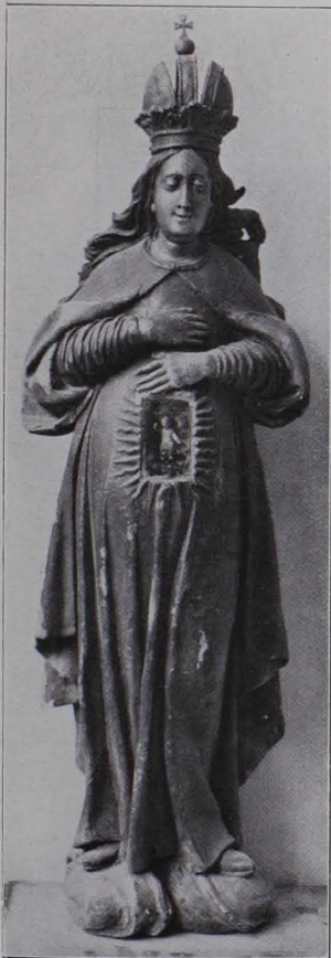
Fig. 102 Adventmaria, Sammlung Orthofer (S. 71)