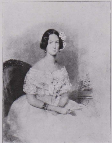
Fig. 71 Miniaturporträt von E. Peter, Sammlung Graf Leopold Kuenburg (S. 51)

11. 88 \times 68 cm; Halbfigur; junge Dame mit grauer Perücke, in ausgeschnittenem braunem Kostüm. Am