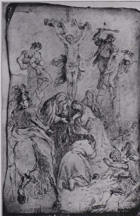
Fig. 65 Zeichnung von Joh. M. Schmidt, fol. 9, Sammlung Kerner (S. 47)