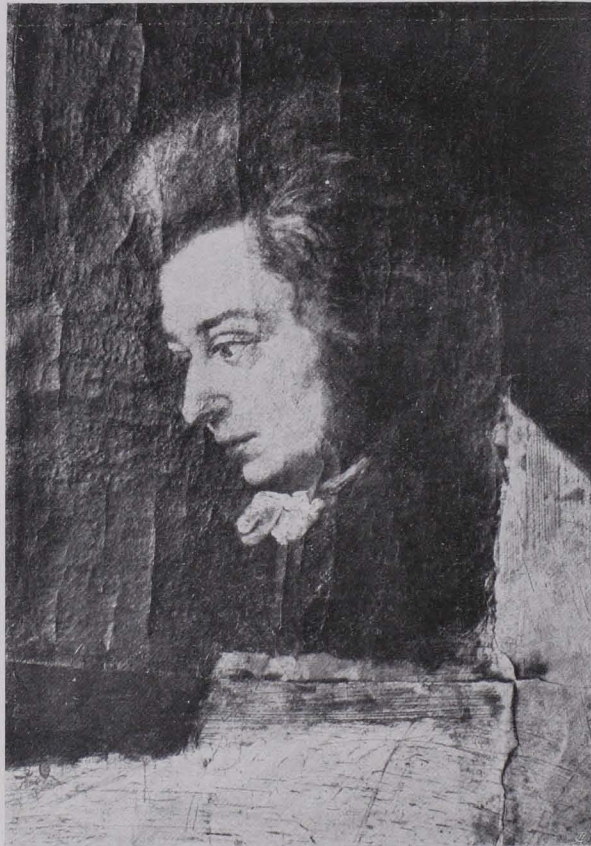
Fig. 177 Porträt W. A. Mozarts von Lange, Mozart-Museum (S. 129)