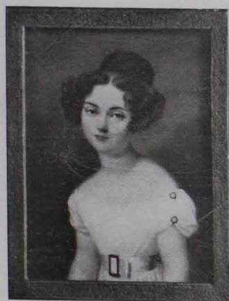
Fig. 179 Miniaturporträt von Henriette Sontag von Augustin, Mozart-Museum (S. 129)

40. Miniatur auf Elfenbein, rund; Durchmesser zirka 5 \text{ cm} ; Brustbild Mozarts als Knabe. Zirka 1772 in Italien gemalt.