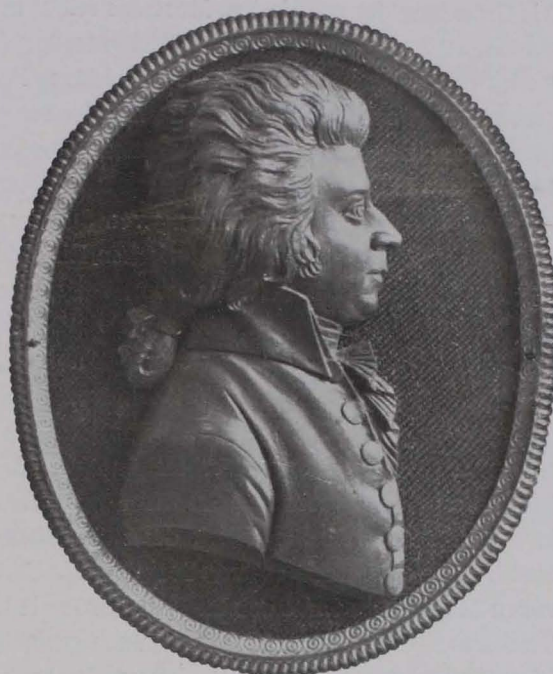
Fig. 178 Buchsrelief W. A. Mozarts von Leonh. Posch, Mozart-Museum (S. 129)