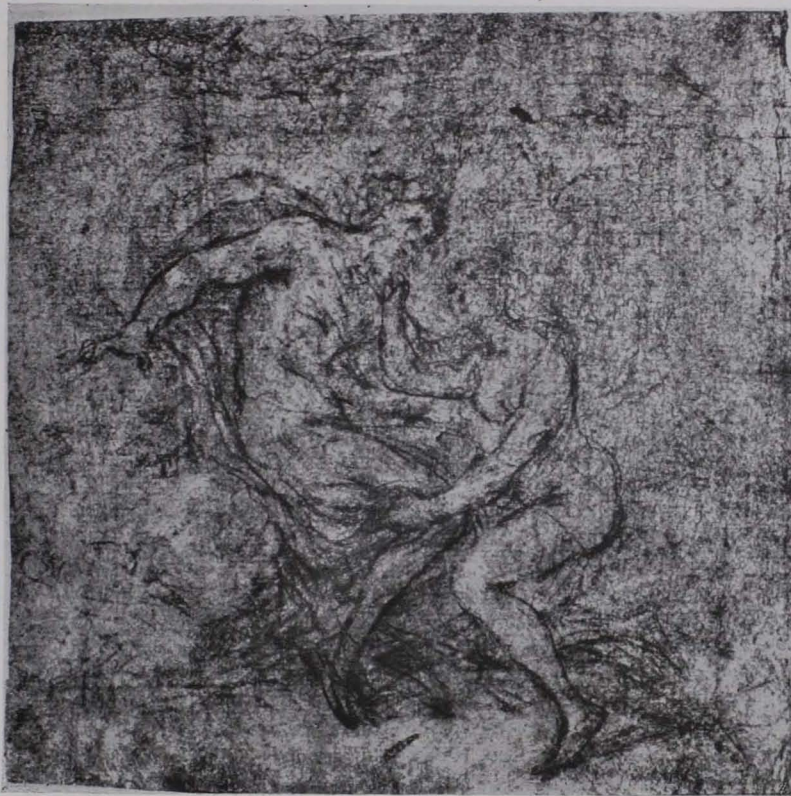
Fig. 165 Mythologische Szene, Bleistiftzeichnung, Studienbibliothek (S. 118)

Fol. 20. 1. Bleistift mit Kreide, 42.5 \times 28 \text{ cm} ; Maria mit dem Kinde, das mehrere männliche und weibliche Mönchsheilige adorieren. Auf der Rückseite Studien. XVIII. Jh. 2. Rötel; drei weibliche antikiisierende Gewandfiguren. Zweite Hälfte des XVIII. Jhs.