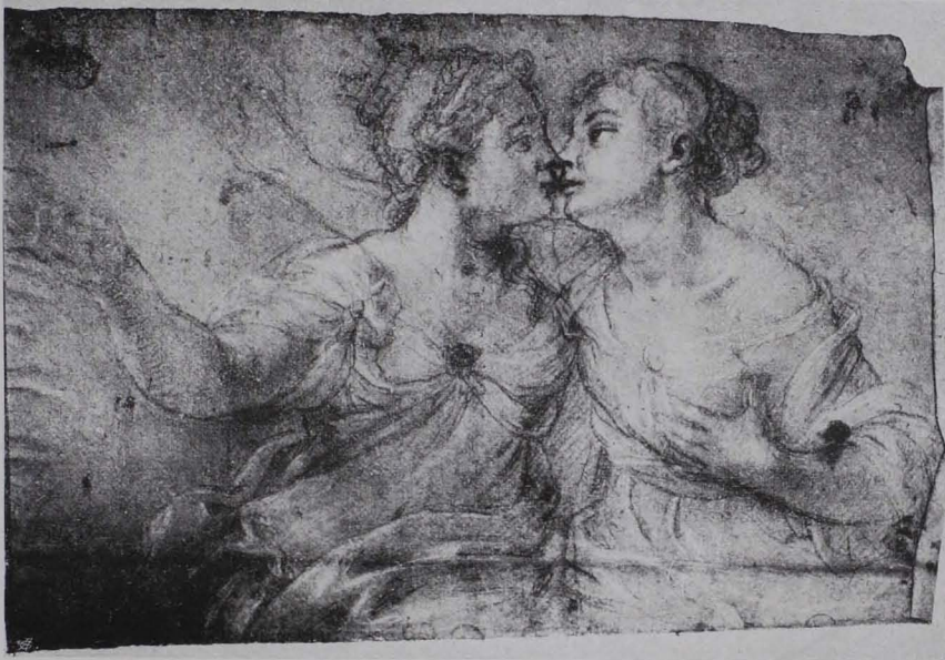
Fig. 168 Bleistiftzeichnung, Studienbibliothek (S. 119)

Fol. 39. 1. Rötzelzeichnung. Details eines Prunkschiffes (Bucentoro, XVIII. Jh.?). 2. Bleistiftzeichnung; Putten aus einer Kiste Musikinstrumente nehmend. XVII. Jh. 3. Bewegungsskizzen.