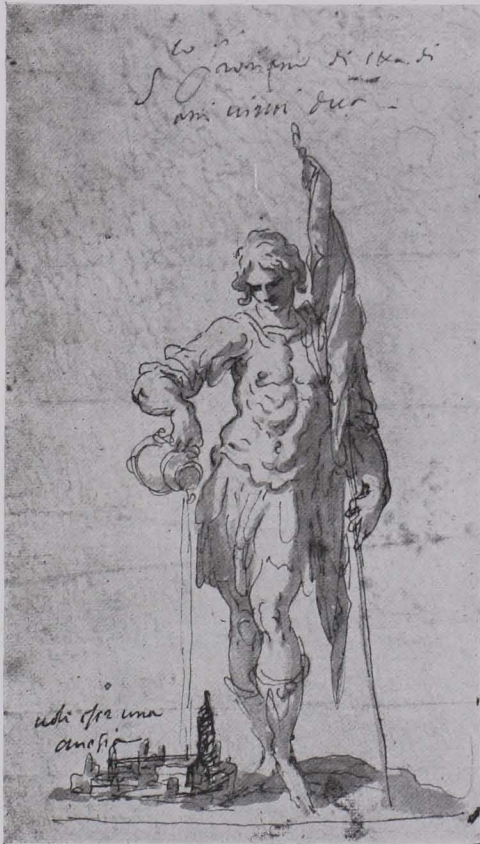
Fig. 169 Hl. Florian, lavierte Federzeichnung, Studienbibliothek (S. 121)

Fol. 56—69. Zum größten Teil zusammengehörige Akt- und Gipsstudien des XVIII. Jhs.