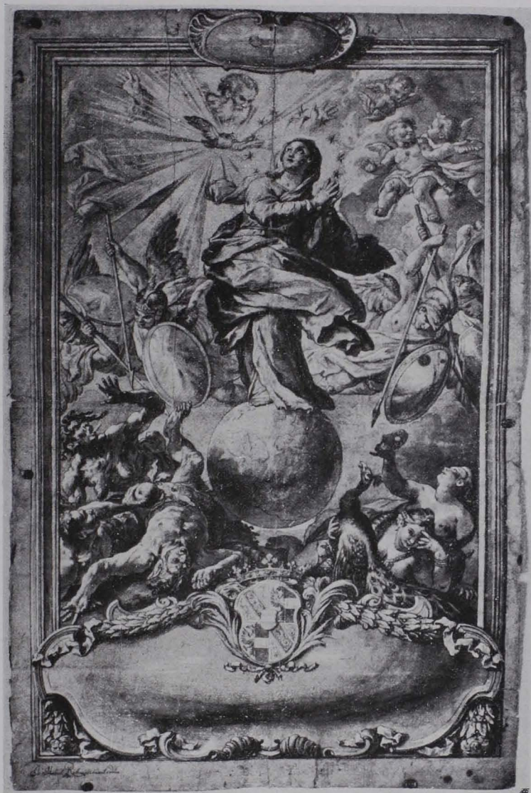
Fig. 174 Tuschzeichnung (Vorzeichnung für ein Thesenblatt) von J. M. Rottmayr, Studienbibliothek (S. 126)

Fol. 148. Rötzelzeichnung; großer, stehender, weiblicher Akt. Auf der Unterlage (dazugehöriges?) Datum 1807.