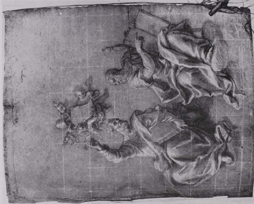
Fig. 167 S. Petrus und Paulus, Kohlenzeichnung, Studienbibliothek (S. 118)