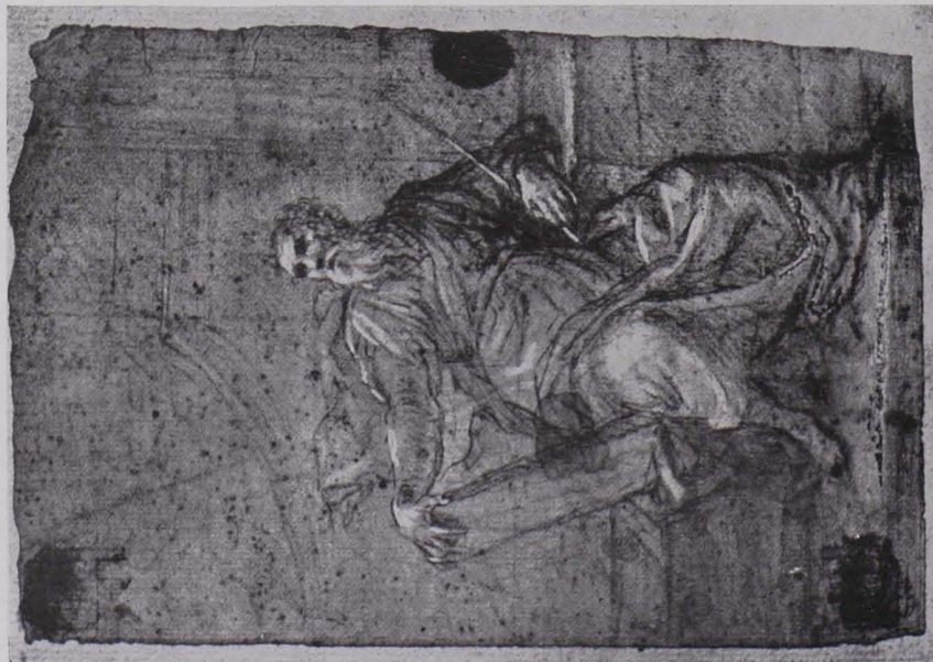
Fig. 166 Drapierte Figur, Stift- und Kreidezeichnung, Studienbibliothek (S. 118)