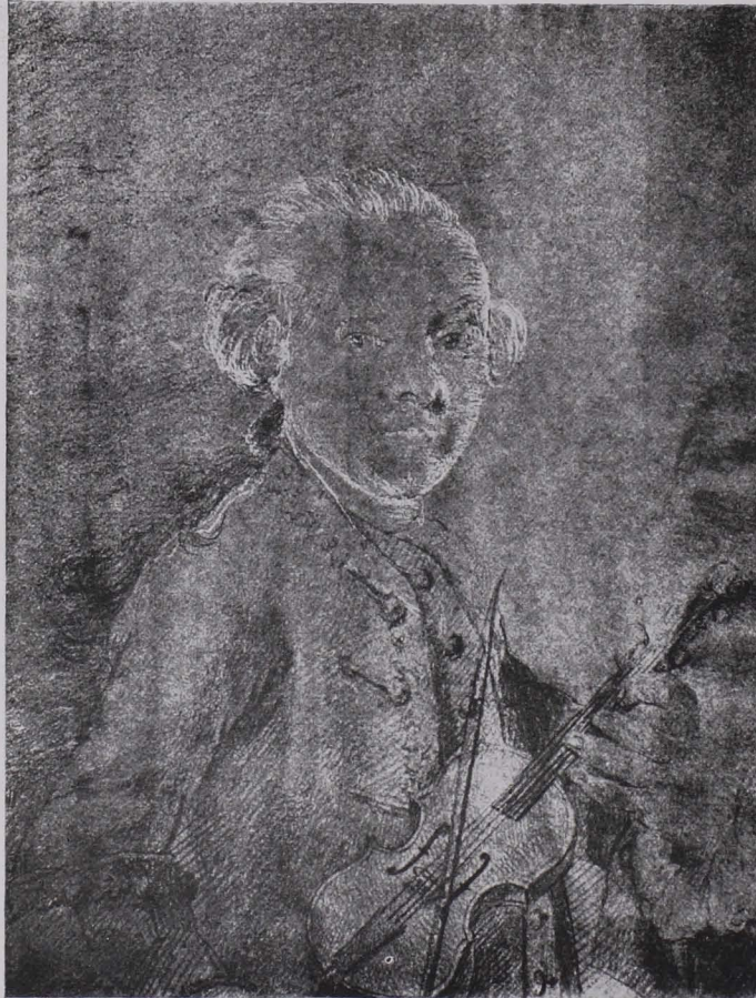
Fig. 175 Bleistiftporträt Leopold Mozarts von L. Firmian, Mozart-Museum (S. 128)

Fig. 174. 1. 49 \times 75 cm; Tuschzeichnung, mit Röteln und Kreide gehöht; Immakulata von Putten und Erzengeln umgeben, über Dämonen triumphierend. Unten Wappen der Grafen Thun. Bezeichnet: Jo Michael Rottmayr invent è delin. 1697 . Rechts in Bleistift: Sim. Benedict Faistenberger (Fig. 174). Vorzeichnung für einen Stich.