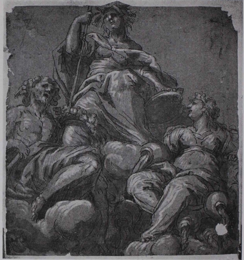
Fig. 172 Deckenskizze, Tuschzeichnung, Studienbibliothek S. 125)