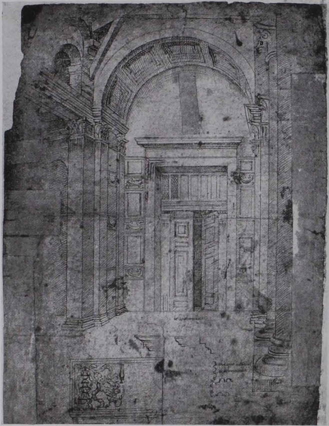
Fig 171 Vorhalle des Pantheon, Federzeichnung, Studienbibliothek (S. 122)