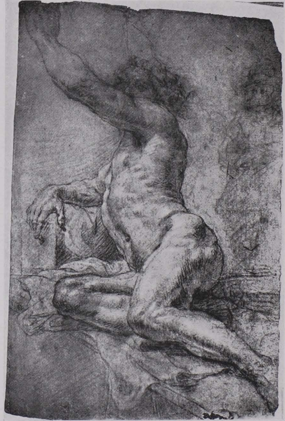
Fig. 170 Aktstudie, Kohlenzeichnung, Studienbibliothek (S. 121)

Fol. 70. 1. Kompositionsskizze in Bleistift einer Himmelfahrt Mariä; unten angedeutet der offene Sarkophag. XVIII. Jh. 2. Braun und rot gehöhte Bleistiftzeichnung einer großen Equipage. Anfang des XVIII. Jhs.