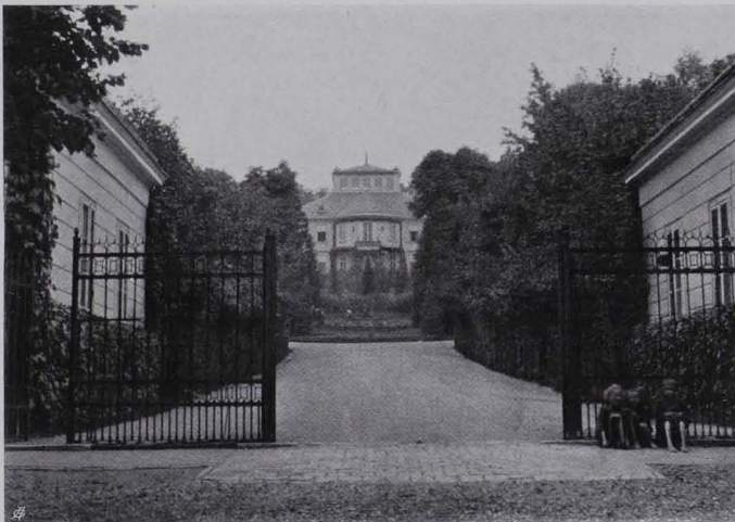
Fig. 60 XIII., Gloriettegasse Nr. 23—29 Beispiel eines vornehmen Landhauses aus dem Vormärz (II)

Nr. 23—29 (II). Vornehmes Landhaus mit großem, bis zur Höhe des Königlberges reichendem Garten. Vgl. Fig. 60.