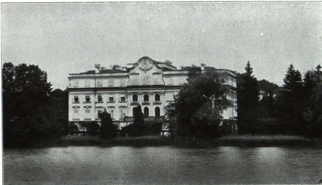
Fig. 273 Leopoldskron. Ansicht von Süden (S. 308)

Östliche Schmalfront (Fig. 272): Gliederung, Fensterformen und Umrahmungen entsprechen denen der beiden Seitenrisalite im N. In jedem der vier Geschosse vier Fenster. Im Hauptteile an den Ecken und in der Mitte je eine Lisene. Entsprechende Lisenen im III. Stockwerke.