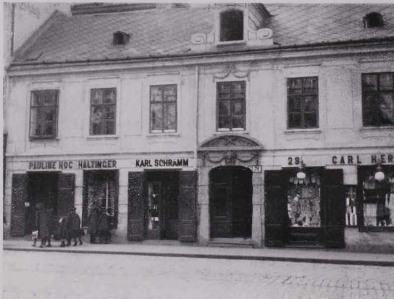
Fig. 56 IX., Währingerstraße 29 (III). Beispiel eines bürgerlichen Vorstadthauses der josefinischen Zeit