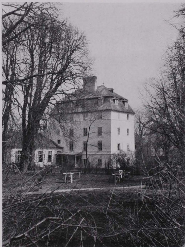
Fig. 63 XIII., Lainzerstraße Nr. 14

Steinkreuz von 1619 (V), eingemauert an der Hausecke von Nr. 8.