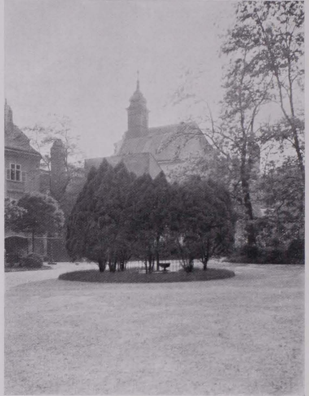
Fig. 65 XIII., Gartenhof im Hause Penzingerstr. Nr. 66 (IV) Im Hintergrund die Filialkirche St. Rochus (1750 erbaut, IV)

Die letzten ebenerdigen Dorfgiebelhäuser Penzings, Nr. 35 und Nr. 37, letzteres mit einem originellen hauswurzüberwachsenen Tor, wurden vor einigen Jahren abgebrochen. An Stelle des letzteren trat ein Neubau, die Stelle des ersteren ist noch unverbaut. Auf dem Plane sind hier also jetzt weiße statt brauner Flächen einzusetzen.