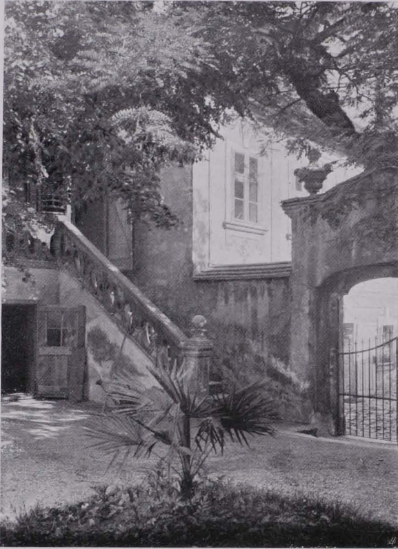
Fig. 64 XIII., Penzingerstraße Nr. 34 Gartenhof eines Landhauses der theresianischen Zeit (IV)