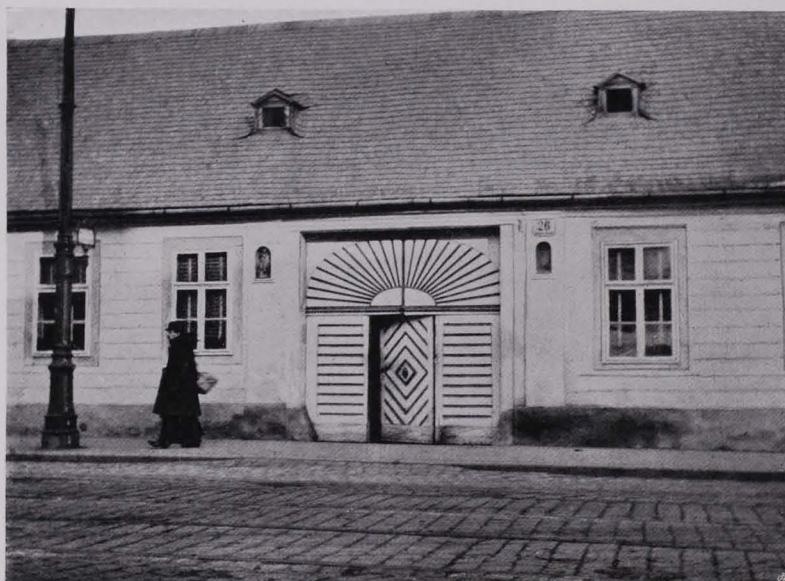
Fig. 61 XIII., Hietzinger Hauptstraße Nr. 26 Übergangsform vom Dorfhaus zum Vorstadthaus aus der ersten Hälfte des XIX. Jhs. Der bäuerliche Charakter des Hauses kommt in der Toranlage zum Ausdruck

Nr. 18 (II). Auch die Vorgärten beider Häuser sind zu erhalten, ebenso jener von Nr. 20 und Nr. 22.