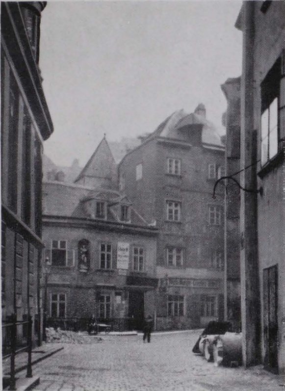
Fig. 2 I., Griechengasse Nr. 7 (III) und 9 (V). Im Hintergrunde der mittelalterliche Haus- turm (VI)

Dieser Einblick in die Altstadt forderte zu einem Vergleiche mit alten, von der Donauseite her aufgenommenen Stadtbildern heraus. Die älteste Ansicht dieser Art ist zugleich das älteste Bild Wiens überhaupt. Es entstammt dem Jahre 1483 und ist auf dem Babenberger Stammbaum im Klosterneuburger Chorherrenstift enthalten. Deutlich läßt sich hier links vom Rotenturm hinter der Stadtumwallung und hinter der ersten Häuserreihe der Stadt, welche also der heutigen Adlergasse entspricht, ein mäßig