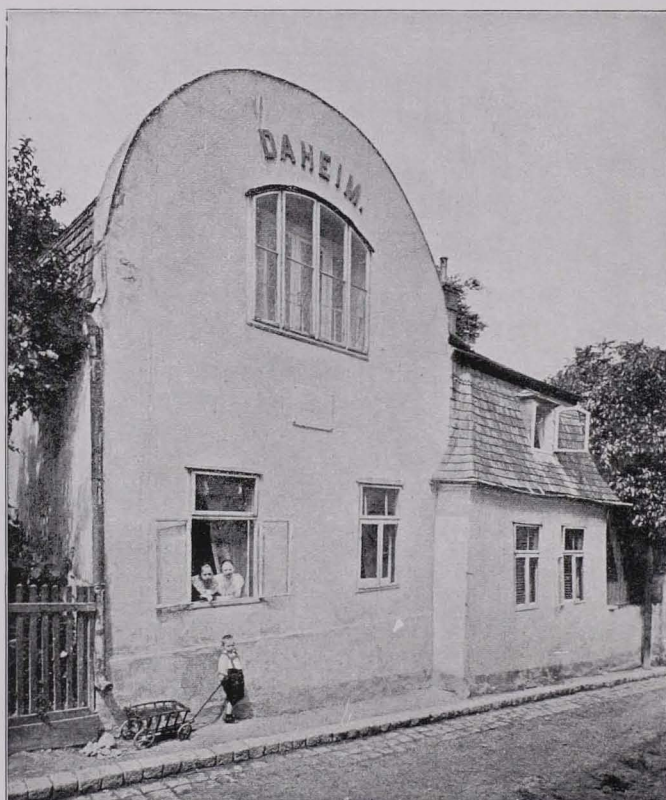
Fig. 71 XIX., Hohe Warte Nr. 37, Villa „Daheim“

Von dieser auf der Höhe der Hohen Warte gelegenen Gasse überraschende Blicke auf den Kahlenberg. Der Charakter der Garten- und Villenstraße ist zu erhalten.