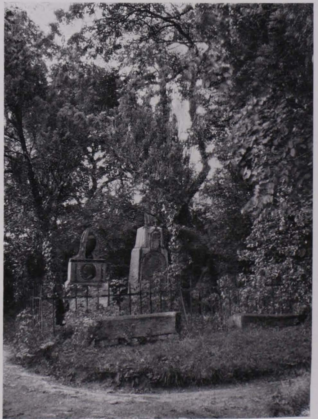
Fig. 74 Im Kahlenberger Friedhof (Josefsdorf)

Stephaniewarte (I). Über die Verunstaltung der Umgebung siehe oben.