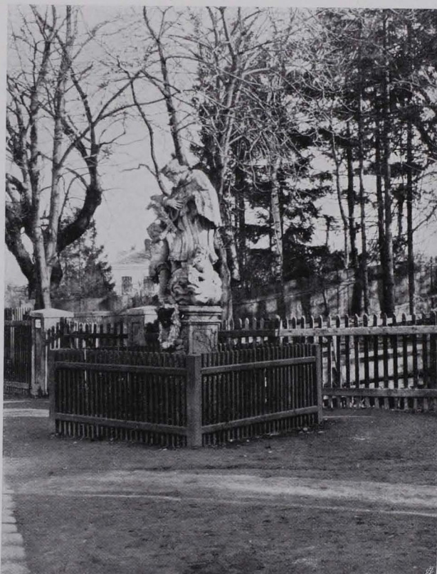
Fig. 76 Johannes v. Nepomuk (IV) in Ober-Sievering beim Hause XIX., Sieveringer Hauptstraße Nr. 179

Der Kern des alten Dorfes Ober-Sievering wird durch eine sehr malerische Straßenge gebildet, welche mit ihren weinbewachsenen, staffelförmig gegliederten Häuschen und dem über der gekrümmten Straße auf