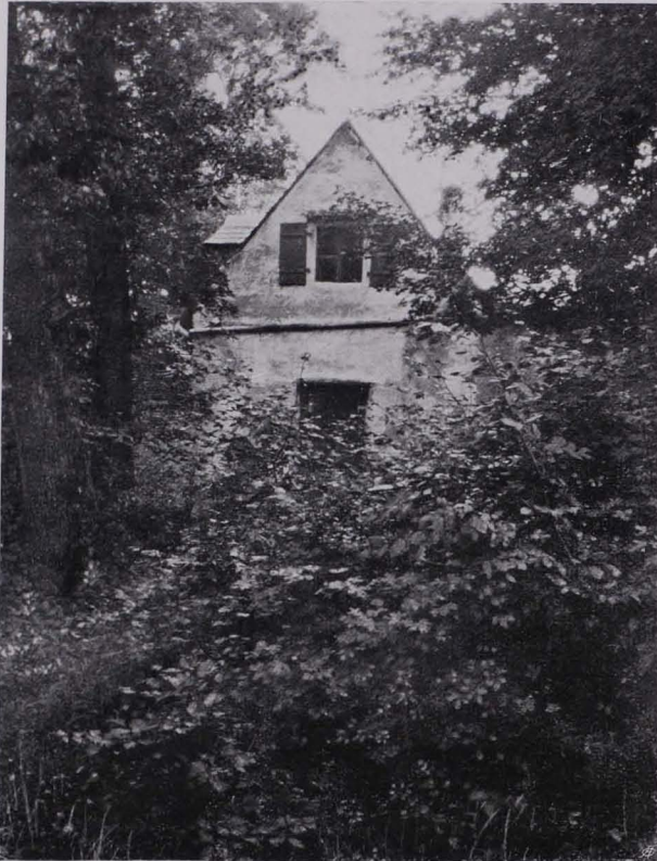
Fig. 73 Klosterzelle des ehemaligen Kamaldulenser-klosters (V) auf dem Kahlenberg