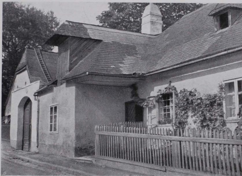
Fig. 75 XIX., Weinhauerhäuser in Nußdorf, Hammerschmidtgasse Nr. 21, 23

Nr. 193 (II). Mit klassizistischen Reliefmedaillons (Ö. K. II, 451; dort fälschlich als Nr. 199 bezeichnet).