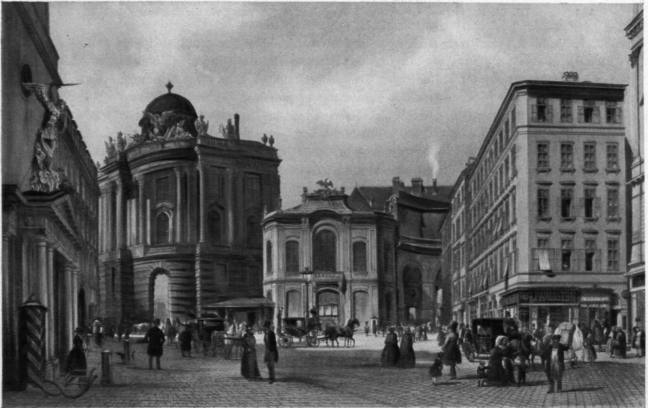
Abb. 245 Blick vom Michaelerplatze auf die Hofburg, nach einer Lithographie von X. Sandmann nach Rud. Alt