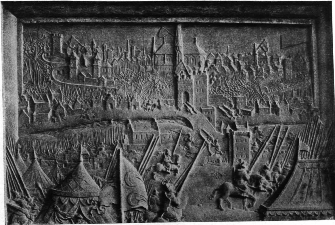
Abb. 87 Relief vom Grabe des Niclas Grafen Salm in der Votivkirche zu Wien, nach den Berichten und Mitteilungen des Wiener Altertums-Vereines