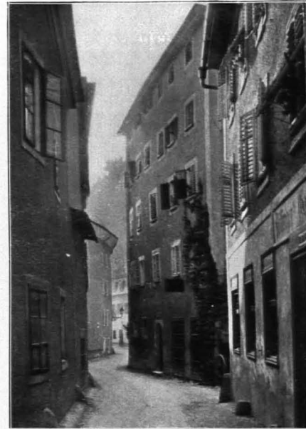
Fig. 415 Steingasse (S. 302)

Quer über die Straße steht das Johannestor oder Inneres Steintor (das Äußere Steintor oder Bürgelsteiner Tor stand ehemals beim Hause Nr. 71; vgl. Fig. 279). Nach dem Steintor eine Luke mit freiem Durchblick gegen die Salzach. Dann schmiegt sich die Straße noch enger an den Felsen, der zwischen den Häusern und Kellern bisweilen bis zum Straßenniveau herunterreicht.