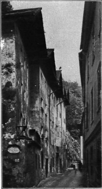
Fig. 413 Steingasse (S. 302)