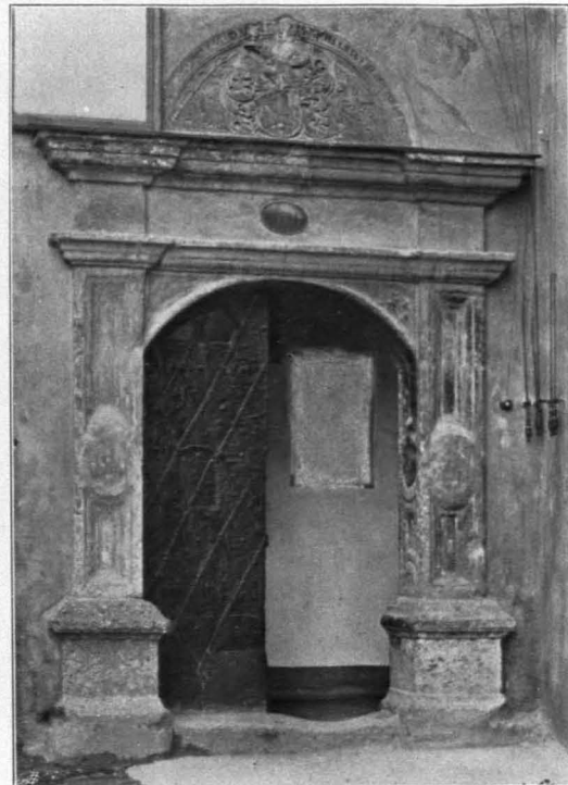
Fig. 417 Hausportal Steingasse Nr. 18 (S. 304)