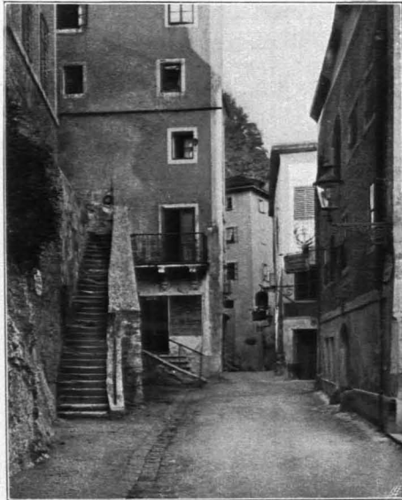
Fig. 414 Steingasse (S. 302)