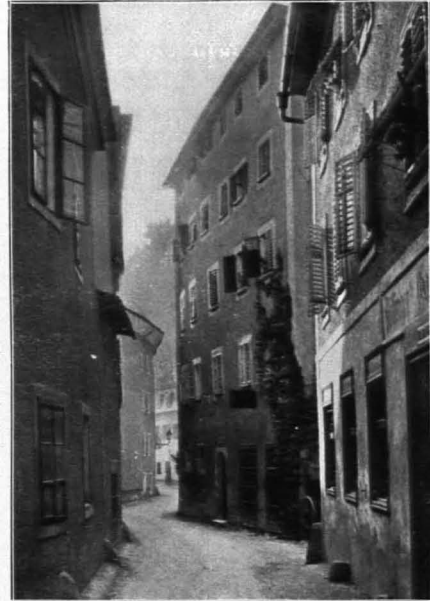
Fig. 415 Steingasse (S. 302)

Quer über die Straße steht das Johannestor oder Inneres Steintor (das Äußere Steintor oder Bürgelsteiner Tor stand ehemals beim Hause Nr. 71; vgl. Fig. 279). Nach dem Steintor eine Luke mit freiem Durchblick gegen die Salzach. Dann schmiegt sich die Straße noch enger an den Felsen, der zwischen den Häusern und Kellern bisweilen bis zum Straßenniveau herunterreicht.