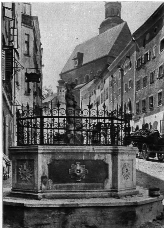
Fig. 388 Müllner Hauptstraße (S. 285)

Nach den Mühlen benannt, die an dieser Hauptstraße von alters her waren. Im Charakter der Hauptstraße einer Landstadt mit natürlichen Biegungen und mit starken Terrainverschiedenheiten. Bis zur Abzweigung der Augustinerstraße ansteigend, dann langsam abfallend. Bis zu dieser Stelle ist die Bebauung eine mehr offene und der steile Abfall des Hügels, auf dem die Augustinerkirche steht, gärtnerisch ausgestaltet. Von da an ist die Bebauung geschlossen, bis die Gasse bei dem quer über sie gestellten Irrenhaus nach W. umbiegt und in eine Landstraße übergeht. An dem Knie bei dem