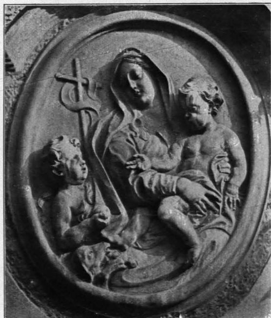
Fig. 387 Relief an der Kapellenfront Fig. 386 (S. 285)

durch einen Schwibbogen einmündenden Bärengäßchen ein kleiner Brunnen (Fig. 388, s. S. 232). Bei den Häusern überwiegen schmucklose Fassaden, die wenigstens in der Anlage (Fig. 389) älteren Ursprungs sind.