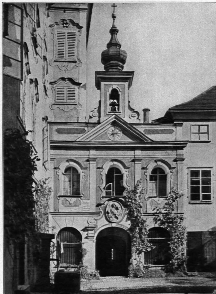
Fig. 386 Ehemalige Hauskapelle im Hof von Mozartplatz Nr. 4 (S. 284)