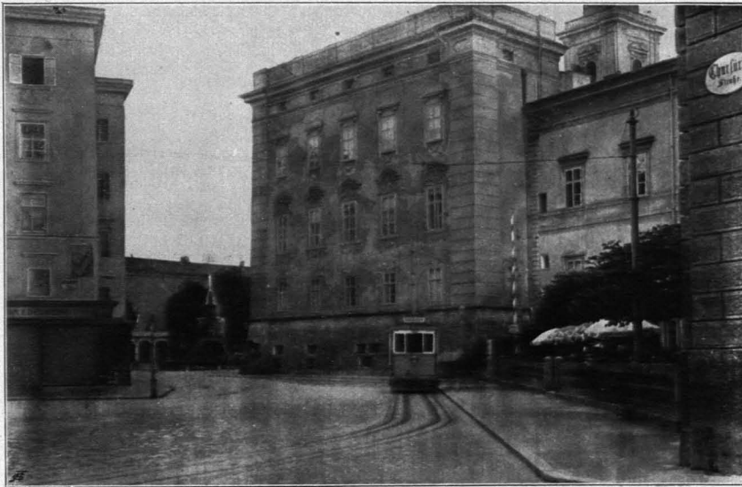
Fig. 375 Ludwig-Viktor-Platz gegen den Residenzplatz (S. 278)

die Schallmoser Hauptstraße über. Die Straße, deren östliche Seite gar nicht, deren westliche nur durch enge Nebengassen unterbrochen ist, macht einen überaus geschlossenen Eindruck, wozu die gleiche Höhe der grobenteils stattlichen Gebäude beiträgt. Sehr viele von diesen stammen aus der Zeit unmittelbar nach