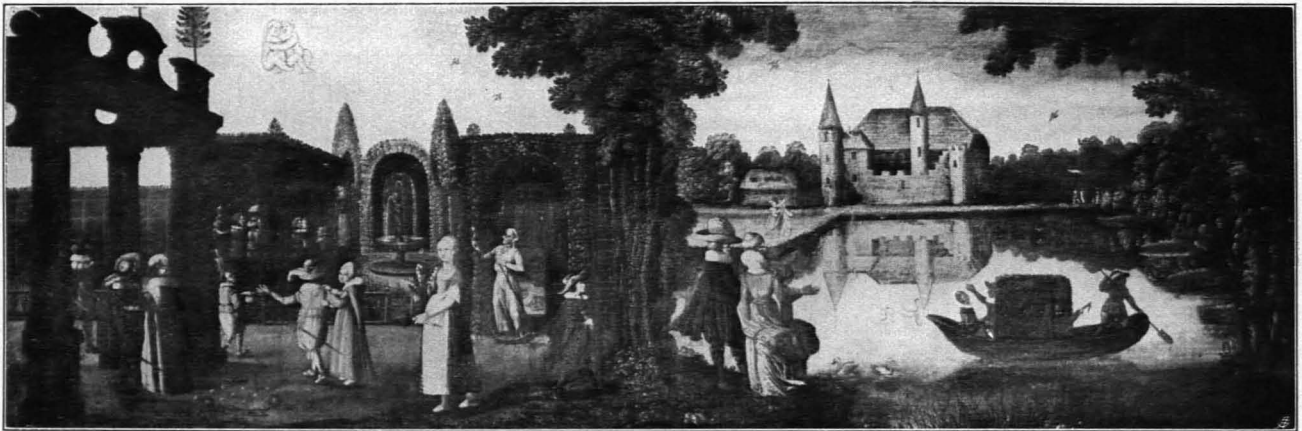
Fig. 335 Schloss Fürberg, Monatsbild, Mai (S. 254)

Schloß an einem Wasser, darauf eine Gondel mit Musizierenden, herum lustwandelnde Paare. Aus Merians Frühling und Mai kombiniert; die Frau vorn und die Laube mit dem Brunnen nach Kager. 6. Juni. Flußlandschaft, rechts ein Ort mit einer Kirche. Links ein Schafhirte und Männer, die sich auskleiden, im Wasser viele Badende und eine Zille. Größtenteils nach Merians Juni.