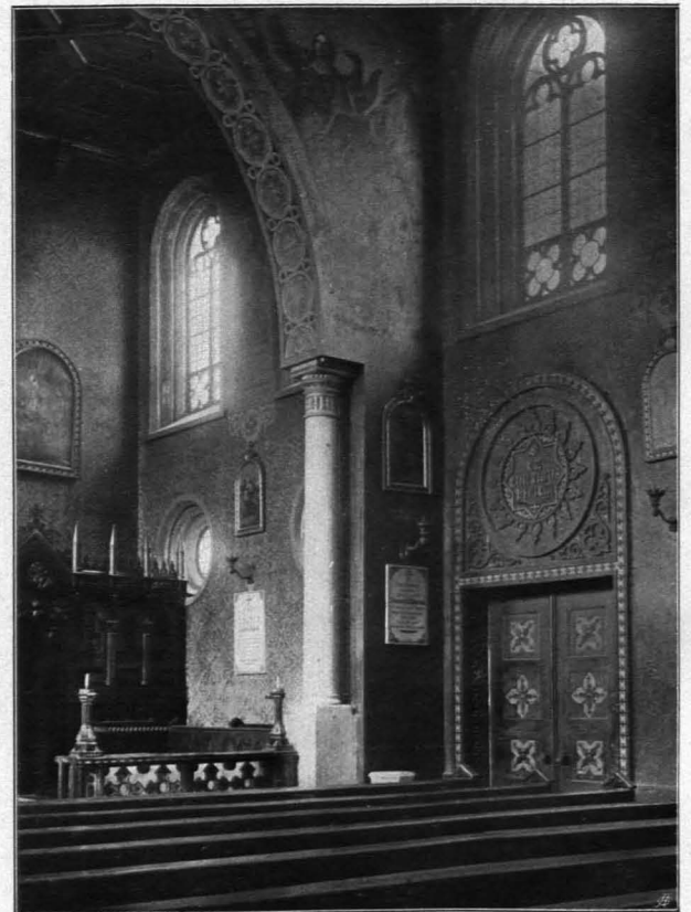
Fig. 322 Borromäum, Inneres der Kirche (S. 244)

Das Gebäude wurde als Graf Lodronscher Primogenituralast vom Erzbischofe Paris Lodron von 1631 an erbaut; der Architekt war wohl Santino Solari. Im XIX. Jh. als Kollegium Borromäum dienend; seit 1912, der Übertragung des Kollegiums in das neue Borromäum in der Gaisbergstraße, zu Wohnzwecken verwendet. Die Grundsteinlegung zu der nach Plänen G. Pezolts erbauten Kirche erfolgte 1846, die Benedizierung 1848, die feierliche Konsekrierung 1864 durch Erzbischof von Tarnoczy (ECKARDT 62 f.; WALLPACH 90).