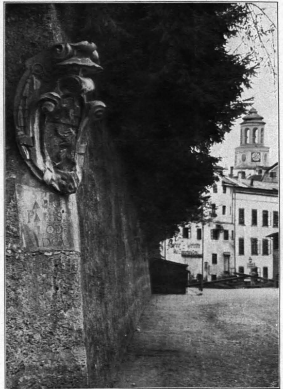
Fig. 317 Rest der Stadtbefestigung, Basteigasse (S. 241)