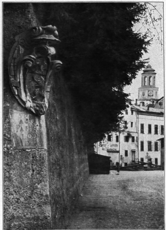
Fig. 317 Rest der Stadtbefestigung, Basteigasse (S. 241)