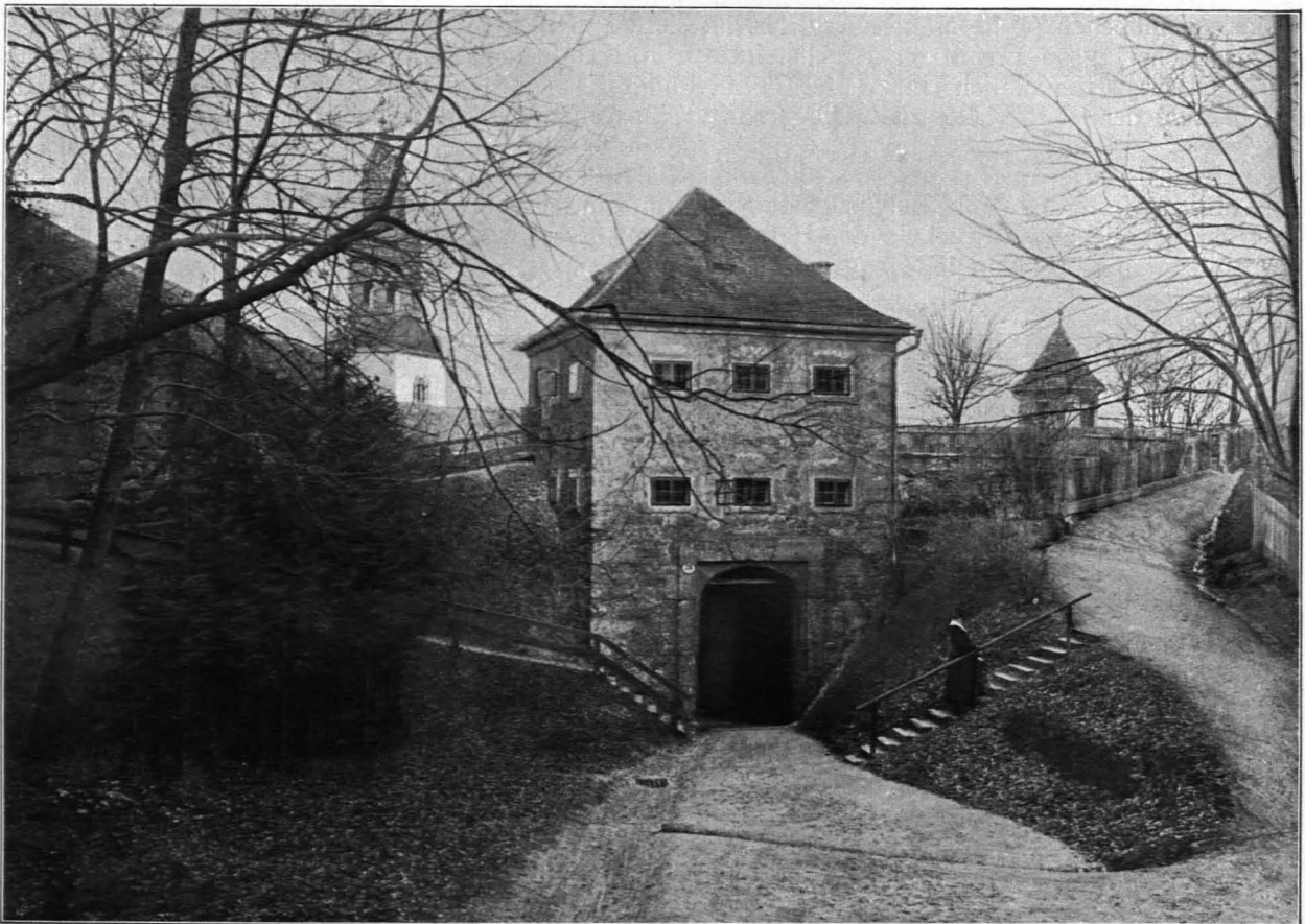
Fig. 315 Augustinspforte vom Mönchsberg (S. 240)