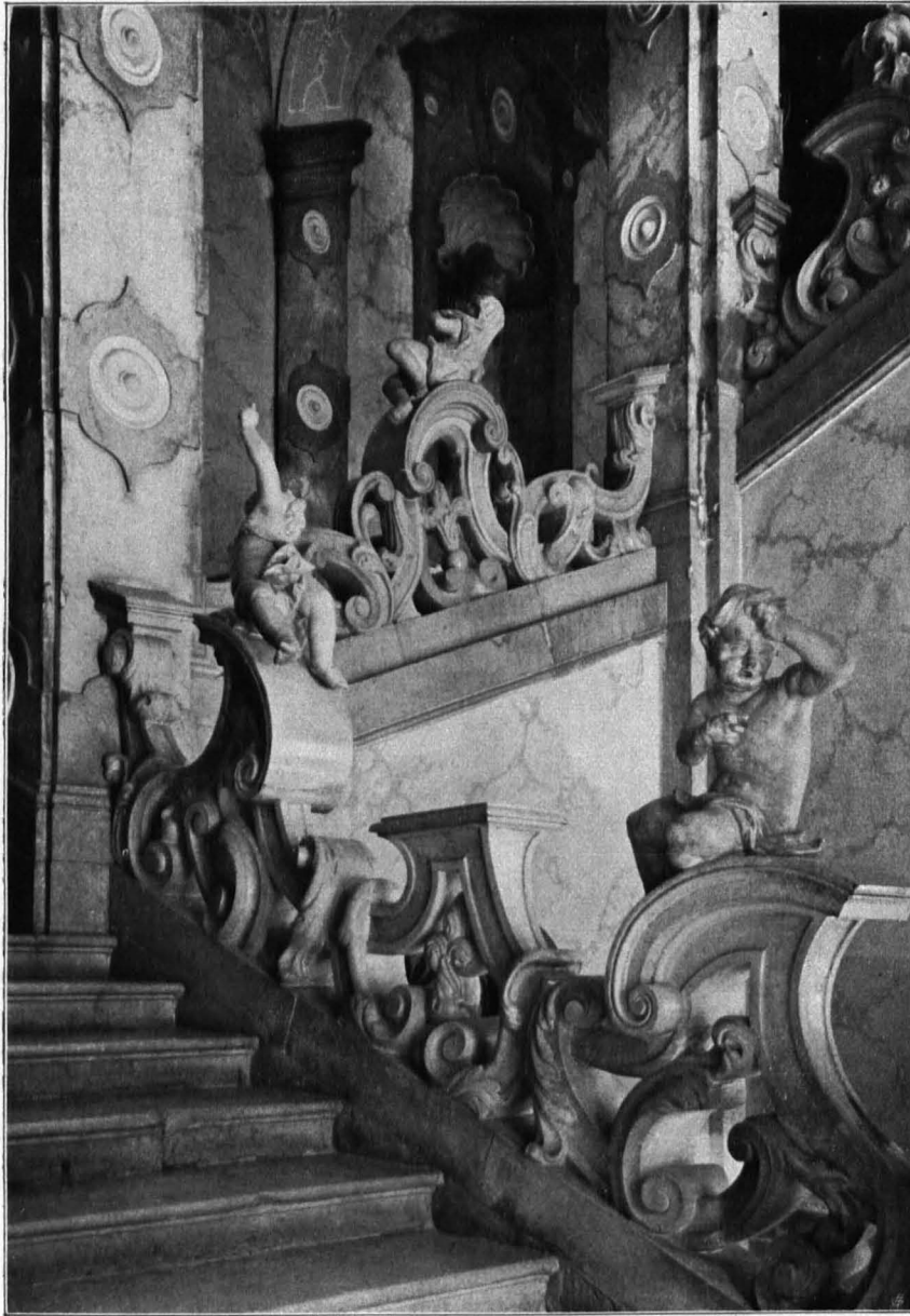
Fig. 252 Mirabell, Hauptstiege (S. 200)