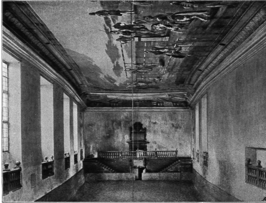
Fig. 214 Hofstallkaserne, Winterreitschule (S. 137)

Sommerreitschule (ungedekte Manege): An der Südseite und Hälfte der Ostseite in den Felsen des Mönchsberges hineingebrochene Galerien in drei Geschossen. Offene, flachbogig geöffnete Bogen, die durch prismatische Pfeiler voneinander getrennt sind. Darüber in der Mitte der Südseite angemauertes Relief-