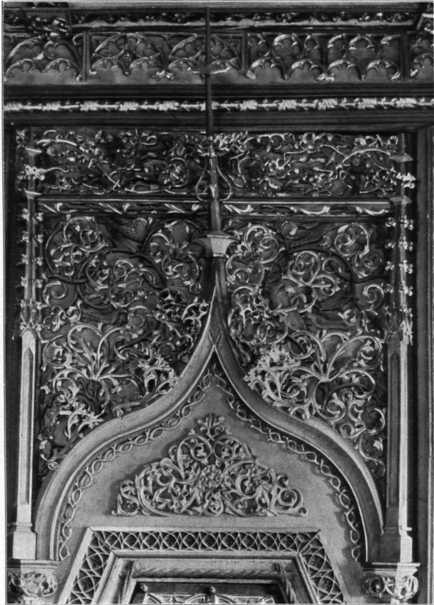
Fig. 191 Hohensalzburg, altes Schloß, Goldene Stube, oberer Teil der Nordtür (S. 122)

besetzten Runddienst wie drüben; ebenso der Türaufsatz mit dem Kielbogen zwischen Fialen. Im Kielbogen Inschrift: 1501 Ertzbischof Leonhart zu Salzburg geporn von Keitschach hat die stuben lassen machen anno domini . Im Felde über der Tür unten bunte Weinranken und bunte Blumen, oben Weinranken.