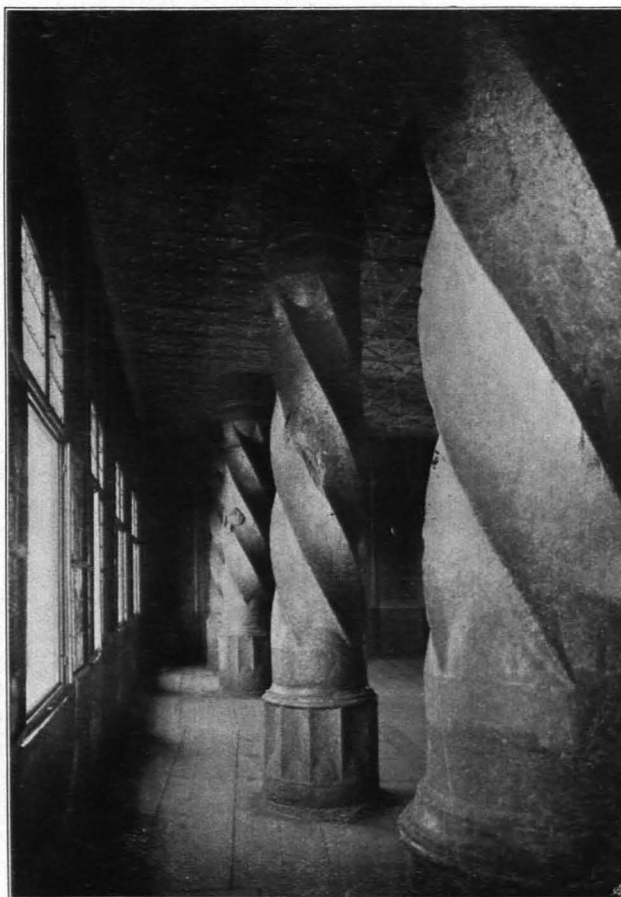
Fig. 185 Hohensalzburg, altes Schloß, Stützsäulen im großen Saal (S. 120)

der sich an den Ecken der oberen Abschlußseiten verkreuzt; herum ein durchbrochener Maßwerkfries. Außen auf gedrehten, polygonalen Sockeln jederseits ein mit vergoldeten Ranken auf blauem Grunde belegter Runddienst mit durchbrochenem Rankenkapital. Darüber vierseitige Fiale, deren Spitze mit Krabben besetzt ist, dazwischen ein außen und innen mit reichem, geschnitztem Rankenwerk besetzter Kielbogen, der mit einer frei gearbeiteten Kreuzblume endet. In der Lünette aufgelegtes vergoldetes Rankenwerk. Die Unterlage des Kielbogens bildet ein, seitlich von den erwähnten Fialen gerahmtes Feld, das durch ein horizontales, rankenbesetztes Gebälk in einen höheren unteren und einen niederen oberen Teil zerlegt wird. In beiden aufgelegtes, polychromiertes und vergoldetes, geschnitztes Rankenwerk, dazwischen