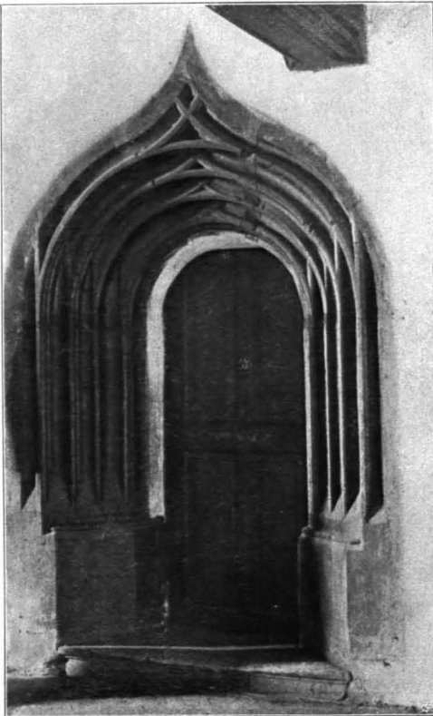
Fig. 178 Hohensalzburg, altes Schloß, Tür laibung im zweiten Stock (S. 117)