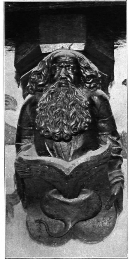
Fig. 177 Hohensalzburg, altes Schloß, Konsolenfigur im Zimmer Nr. 38 (S. 116)