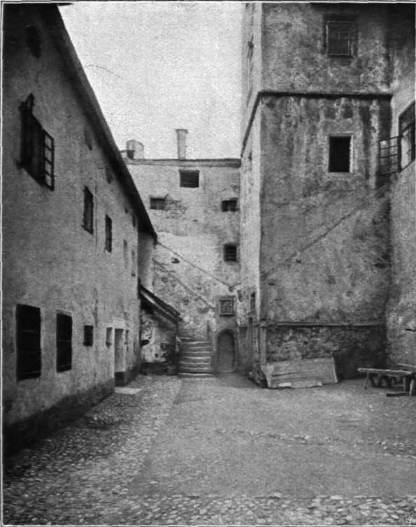
Fig. 158 Hohensalzburg, innerer Schloßhof gegen die Pfisterei (S. 107)