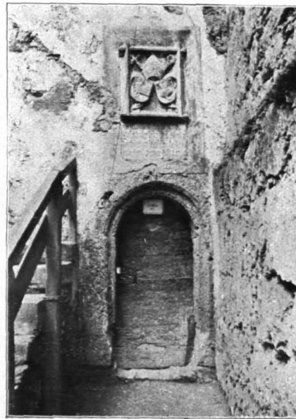
Fig. 159 Hohensalzburg, Tür der Pfisterei (S. 107)