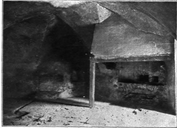
Fig. 160 Hohensalzburg, Inneres der Pfisterei (S. 107)