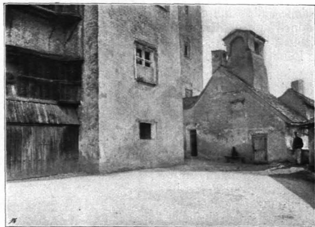
Fig. 162 Hohensalzburg, Schloßbastei, im Hintergrunde die Räucherzimmer (S. 109)