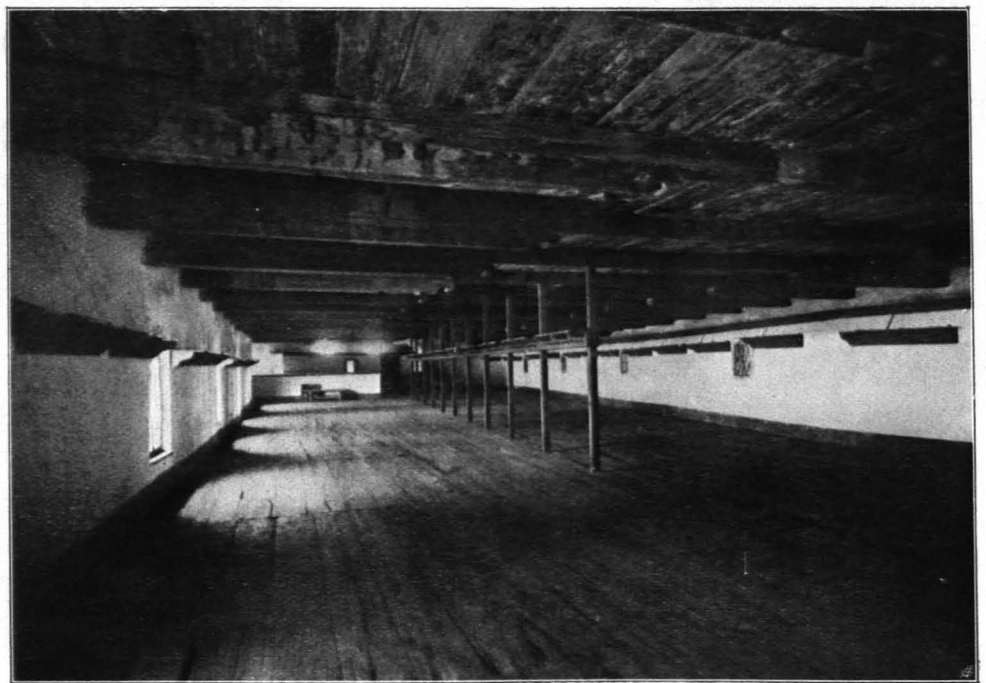
Fig. 131 Hohensalzburg, Saal im Arbeitshaus (S. 95)

Im O. führt eine Stiege herunter in das Zeughaus, das an der Nordseite eine Reihe von Schlitzen enthält. Es besteht aus einer Reihe von unregelmäßigen gratgewölbten Räumen. Im Fußboden (über der Roßpforte) zwei runde Öffnungen mit Steindeckeln (Fig. 128). Die einzelnen Räume sind voneinander durch schwere Eisentüren mit reichen Beschlägen aus