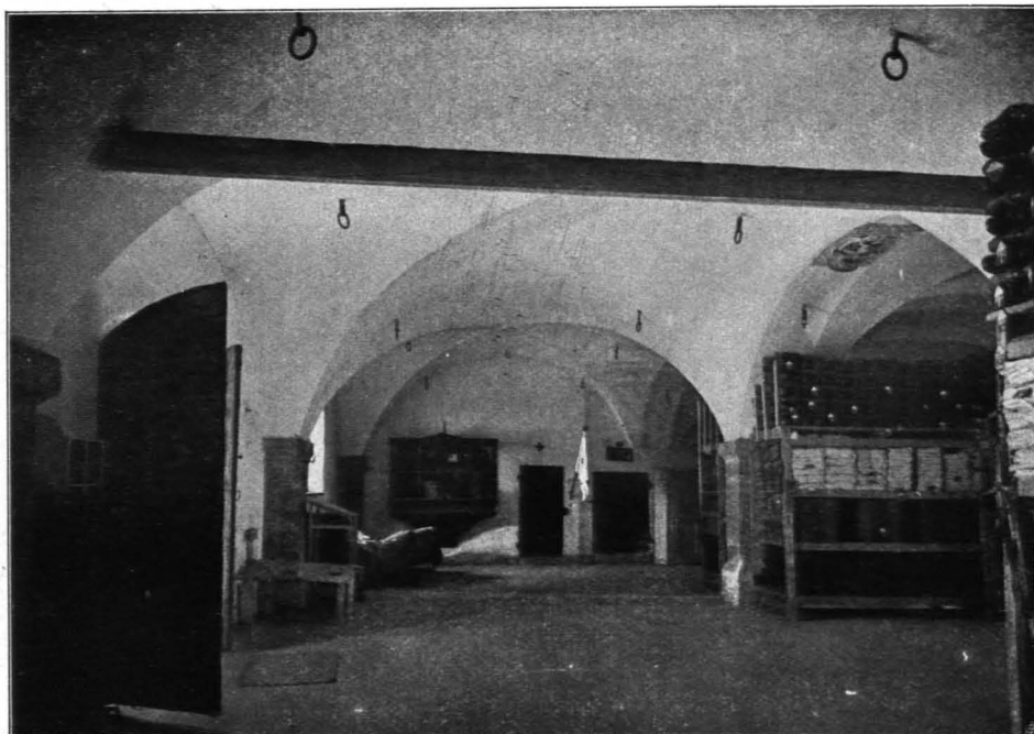
Fig. 126 Hohensalzburg, Magazin im Zeughaus (S. 94)

pforte mit flachbogiger Toröffnung zu der Stiege und dem Fußsteig. Daran schließt sich das Kasernkommando, einstöckig, mit rechteckigen Fenstern und zwei schrägen Stützpfelern.