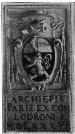
Fig. 127 Hohensalzburg, Wappen des Erzbischofs Paris Lodron im Magazin des Zeughauses (S. 94)

in Sandsteinrahmung mit Eckbändern. Eingemauerte dunkelrote Marmorplatte mit Wappen Kuenburg und Inschrift auf Erzbischof Michael von 1558. An der Westseite ein ähnliches vermauertes Tor (Fig. 113). Hier stößt das schmale Büchsenmacherstöckel an, dessen Front im Erdgeschoße von zwei Türen eingenommen wird und das mit dem nächsten großen Gebäude (Schüttbodengebäude) durch winkliges Gebäudewerk verbunden ist, unter dem sich der Schwibbogen, der der Fahrstraße Durchlaß öffnet, befindet (s. oben S. 86, Fig. 112).