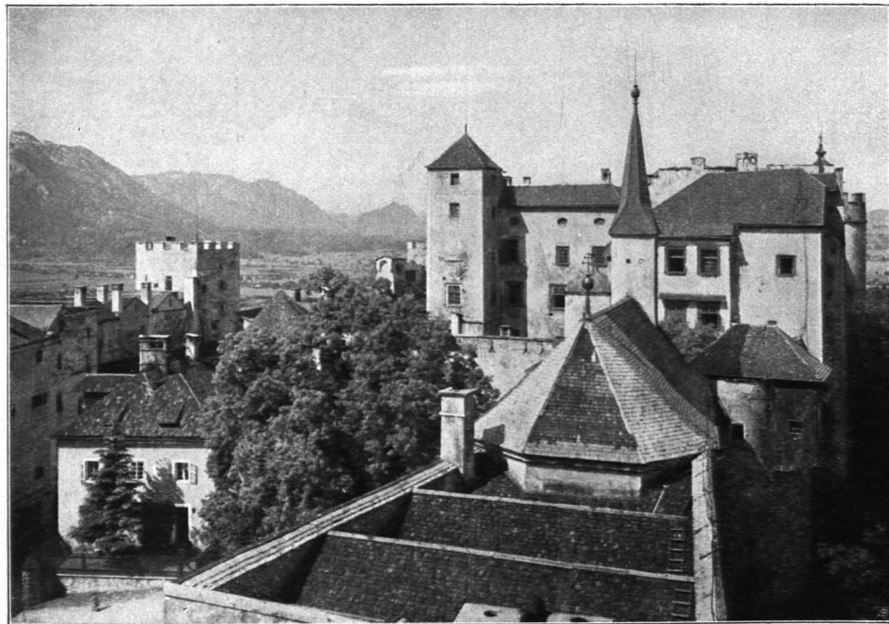
Fig. 124 Hohensalzburg, Blick vom Trompeterturm gegen das alte Schloß; vorn das Reiszuggebäude, hinten die Georgskirche (S. 93)