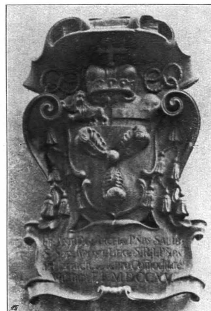
Fig. 119 Hohensalzburg, Wappen des Erzbischofs Franz Anton Harrach am Speisehaus (S. 90)

und Salzmagazin (Fig. 121). Grau verputzt, mit unregelmäßig angebrachten, verschieden großen Türen und Fenstern; mit sechs ganzen und zwei halben kleinen Flachgiebeln des Schindelgrabendaches gegen den Hof gestellt. Eingemauerte rote