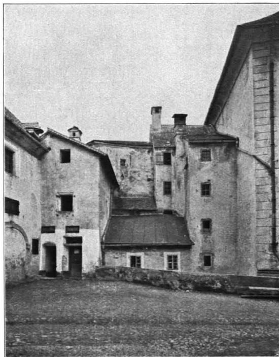
Fig. 111 Hohensalzburg, Arrestantenturm mit Vorgebauten (S. 86)

Hofes bildenden Gebäuden und dem Komplex des alten Schlosses zunächst gegen W., sodann gegen N. und mündet, nach Brücke und Sperrbogen, gegen O. gerichtet, in den Feuergang ein. Jenseits (östlich) des alten Schlosses schließen sich weitere Gebäude an und vervollständigen das unregelmäßige Rechteck des äußeren Schloßhofes (Fig. 113). Die Beschreibung fährt bei dem Gebäude fort, das sich zunächst an den Durchlaß der Roßpforte anschließt, nämlich dem Schüttbodengebäude mit Ortsteineinfassung und Hohlkehlegesims, dreigeschossig mit einem Bodengeschoß; der Sockel durch profiliertes Gesims abgetrennt, sonst in der Mitte des XIX. Jhs. gotisierend fassadiert (Fig. 114). Eingemauerte rote Marmortafel