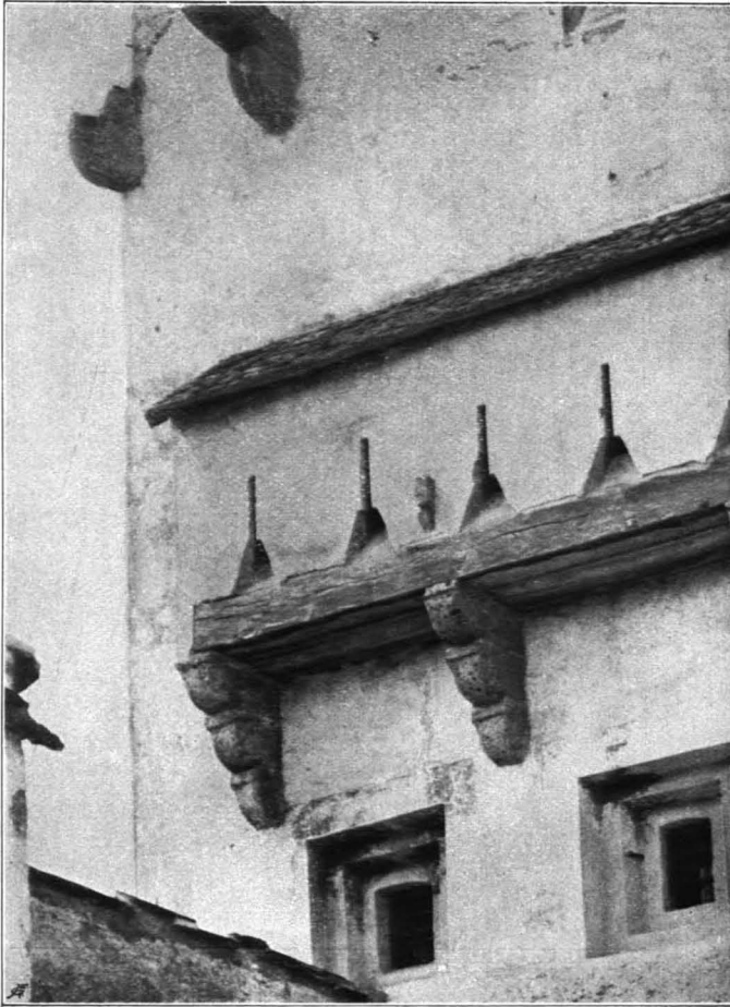
Fig. 109 Hohensalzburg, Roßpforte, oberer Teil (S. 85)