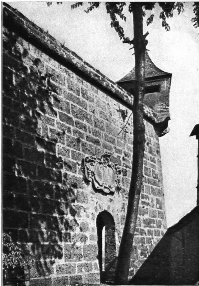
Fig. 108 Hohensalzburg, Kuenburgbastei, Durchlaß zur Kasematte (S. 85)

Roßpforte: Kleine aufstehende weißgrau verputzte Wand (Fig. 96). Rundbogiges Portal mit gestuft profilierter Einfassung, daneben rundbogiges Durchlaßtürchen; daneben ein Fenster mit gotisch profiliertem Eisengitter aus Stäben, die durcheinander geflochten sind. Darüber drei