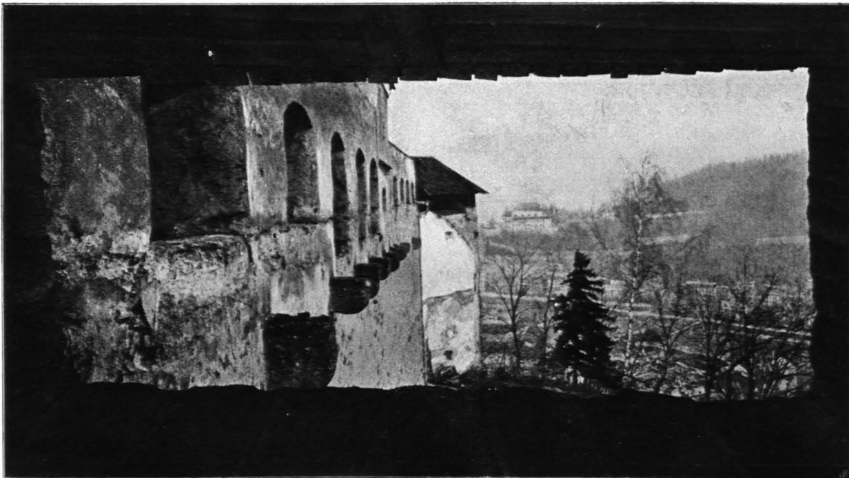
Fig. 98 Hohensalzburg, Schlangengang gegen den Schlangenturm (S. 84)