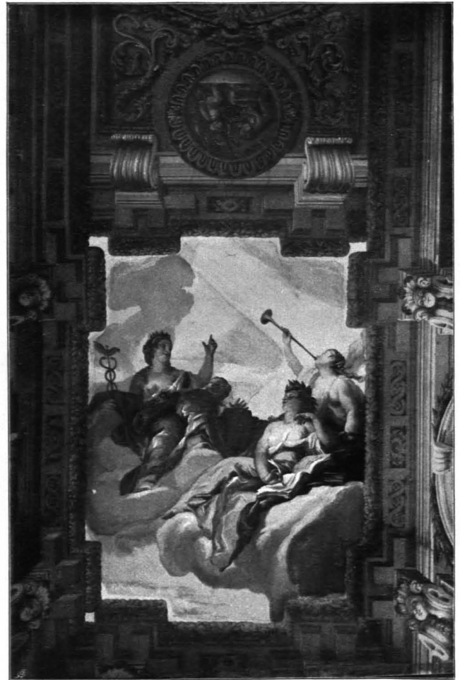
Fig. 34 Residenz, Bildergalerie, Deckengemälde von J. M. Rottmayr (S. 31)