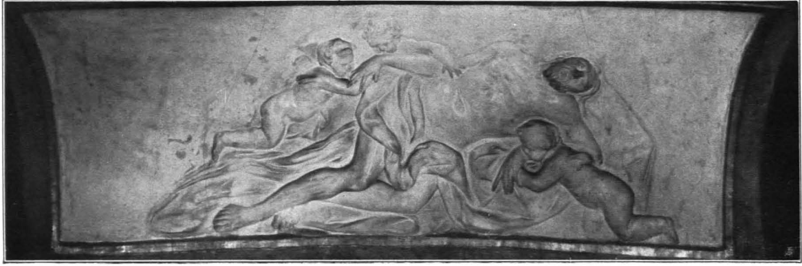
Fig. 32 Residenz, Mensa des Kapellenaltars (S. 28)

als Kind, oben Gott-Vater und die Taube. Art des Rottmayr. Um 1710. Seitlich große adorierende Engel aus Stuck, oben drei Putten mit dem Kreuz in Glorie.