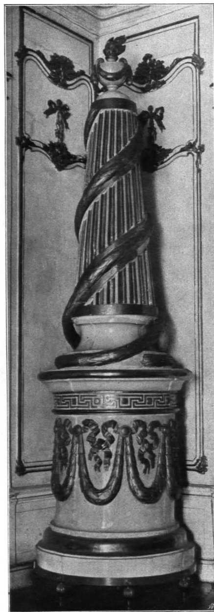
Fig. 29 Residenz, Schlafzimmer, Ofen (S. 25)

Fig. 32. An der Vorderseite der konkaven Mensa Relief aus Stuck, der Leichnam Christi von drei Putten betrauert. Arbeit unter Einfluß des G. R. Donner (Fig. 32). An der Rückwand darüber die Madonna mit dem stehenden Kinde, mit der hl. Katharina, dem hl. Josef und Johannes Baptist