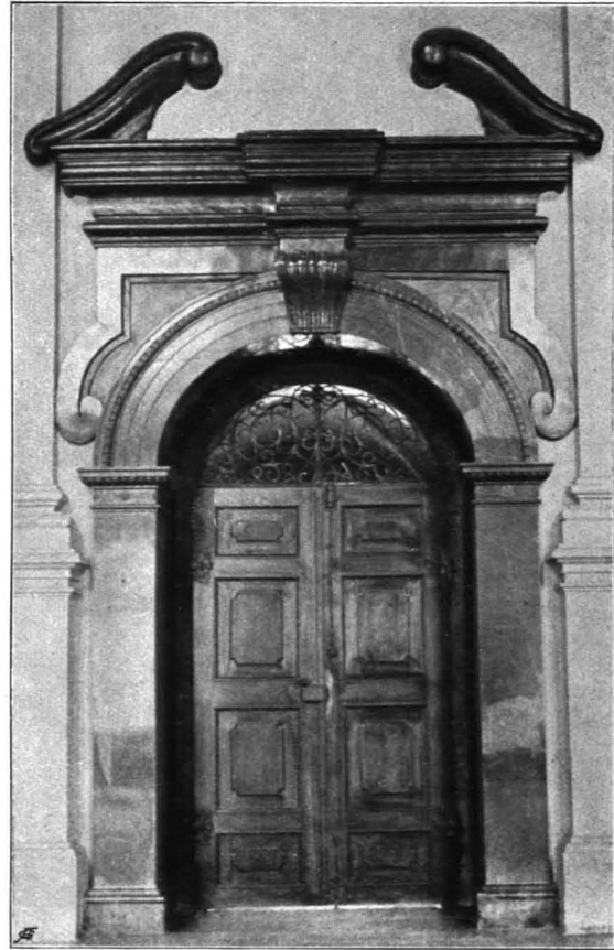
Fig. 13 Residenz, Tür im Karabinersaal (S. 17)

platte, gestuftem, gleichfalls mit Eierstab besetztem Rundbogenabschlusse mit Volutenkeilstein, gegen O. mit zwei Türen in gelbmarmorner profilierter Rahmung, mit einem von zwei akanthusblattbesetzten Volutenkonsolen gestützten gesprengten Segmentgiebel. Gegen den Stiegenaufgang (Glastür und) schmiedeeisernes Gitter aus Spiralranken, im Aufsätze ausgeschnittene Grottesken und bemaltes Wappenschild des Fürsterzbischofs Kuenburg, zweite Hälfte des XVII. Jhs. (Fig. 12). Die Decke des Vorplatzes ist ein gotisierendes Spiegelgewölbe, dessen Stuckrippen mit leichtem Blattwerk besetzt zu einem quadratischen Mittelfeld in einer mit Cherubsköpfchen besetzten Rahmung konvergieren. Das Gewölbe ruht auf umlaufender Kornische, die sich zu Wandträgern verbreitert. Erste Hälfte des XVII. Jhs.