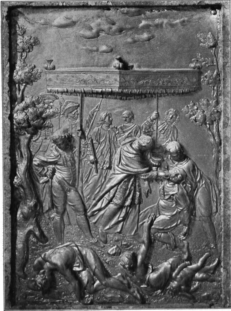
Fig. 222 Universitätsgebäude, Bleirelief am Hochaltar des Sacellum (S. 146)