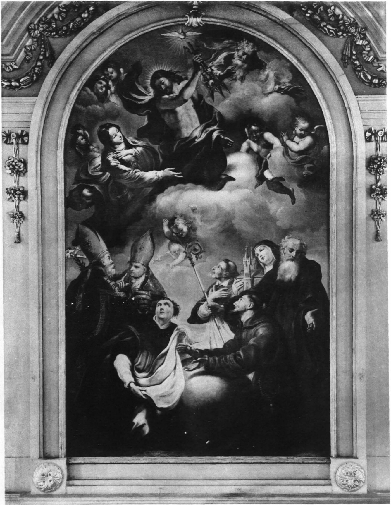
TAFEL XV UNIVERSITÄTSGEBÄUDE, AULA, ALTARBILD VON ADRIAN BLOEMART (S. 142)