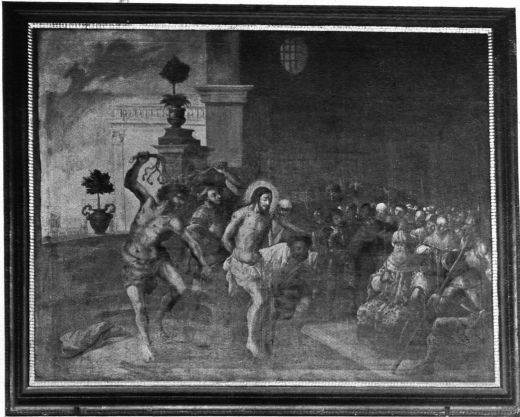
Fig. 225 Universitätsgebäude, Gemälde im Sacellum (S. 146)

Wandschrank: Tür mit geschwungenem Abschluß und seitlich rahmenden Volutenbändern aus schwarzem Holz mit vergoldeter Schnitzerei: Gitter-, Band- und Volutenwerk, in Blätter auslaufend. Um 1725.