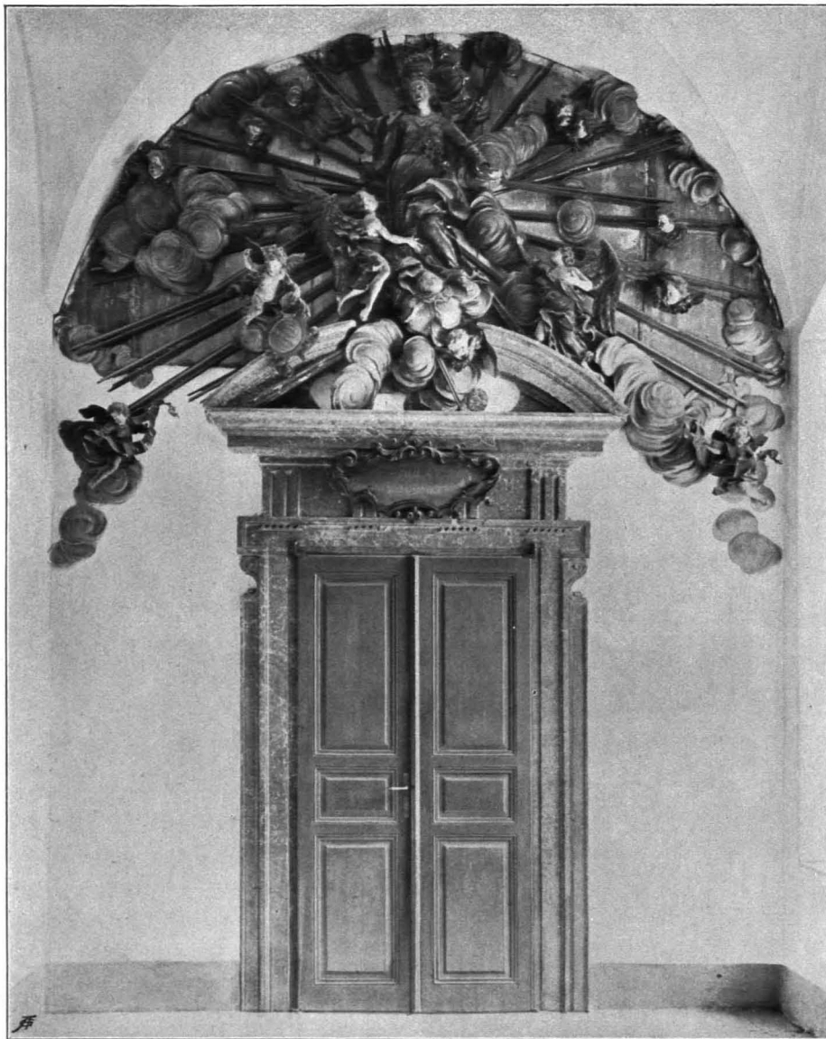
Fig. 217 Universitätsgebäude, Tür zur Aula (S. 141)

liche Tür in der unteren Hälfte vermauert. Letztes Viertel des XVIII. Jhs. Zwei weitere einfachere Türen an den äußeren Enden der Flügel. In dem im stumpfen Winkel angebauten Westtrakt (Siegmondsplatz 8) ist in der südlichen Hälfte unten das Sacellum eingebaut. Die fünf hohen rechteckigen Erdgeschoßfenster durchbrechen das Kranzgesims mit einer blinden Rundbogenlunette; darüber breitovale Fenster in glatter Rahmung. Der Südtrakt gegen die Hofstallgasse enthält in seinem westlichen, etwas niedrigeren Ende das Portal zum Sacellum; seine Marmorrahmung besteht aus seitlichen Streifen mit Rosetten in den oberen Ecken und einer Inschrifttafel unter ausladendem Sturz. Darüber ein von Voluten gerahmter, von doppelt eingerollten