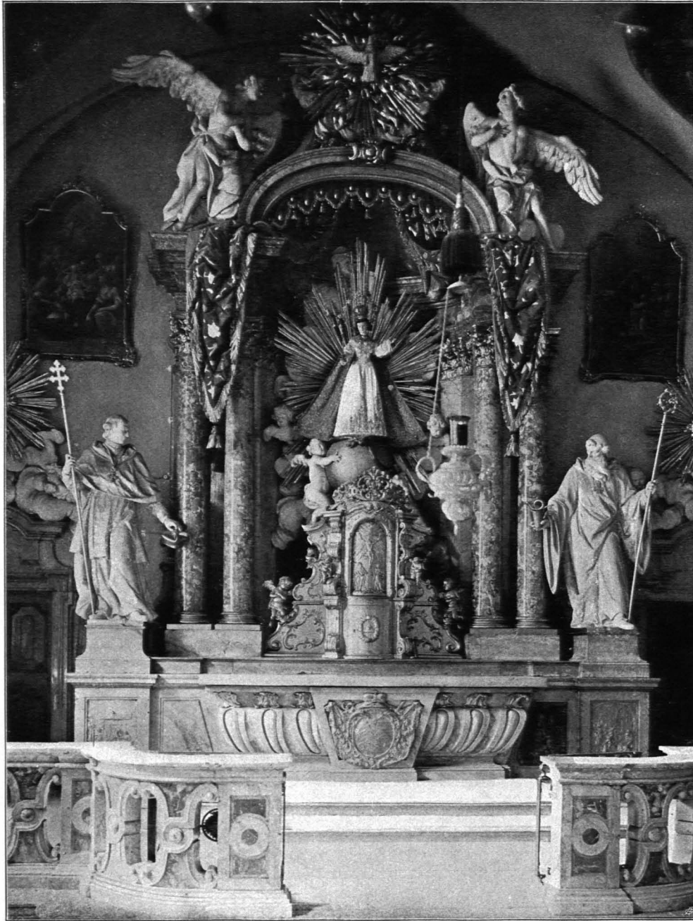
Fig. 221 Universitätsgebäude, Hochaltar des Sacellum (S. 144)

Altäre: 1. Hochaltar: Skulpturenaufbau aus rosa und grauem Marmor, mit vergoldeten Bleireliefs und dick überstrichenen weißen Holzfiguren (Fig. 221). Unterbau mit vorspringender Mensa mit Kannelierungen und Stäben, in der Mitte Wappen des Sigismund von Schrattenbach (Blei, vergoldet); seitlich prismatische Postamente, in deren Vorderseiten vergoldete Bleireliefs: Hl. Karl Borromäus, den Pestkranken das letzte