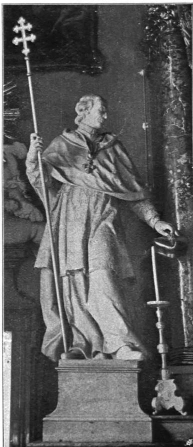
Fig. 224 Universitätsgebäude, Figur des hl. Karl B. vom Hochaltar des Sacellum (S. 144)

Tabernakel, Holz vergoldet, vorgebaucht mit seitlichen Flügeln in ausgezackter Volutenform, durch ein Sims in zwei Geschosse geteilt. Die vorderen Kanten werden in beiden als Volutenbänder eingerollt; über geschlungenem, abschließendem Sturz aufgesetztes Ornament. Mehrere kleine, minder sorgfältig gearbeitete Putten, kerzentragend oder mit adorierender Gebärde. An der Tabernakeltür Relief, Kruzifixus zwischen Maria und Johannes. Um 1760.