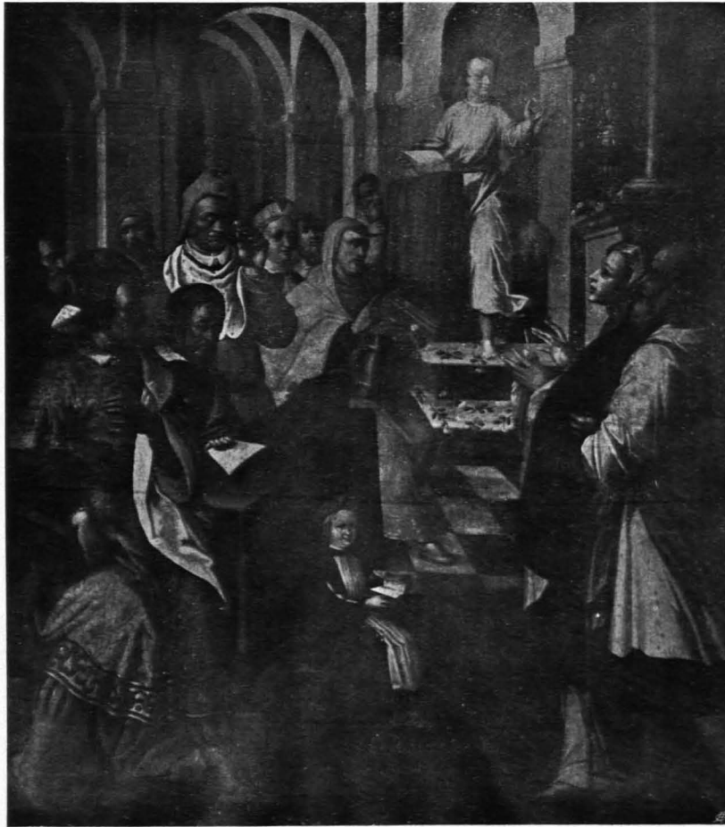
Fig. 218 Universitätsgebäude, Aula, Jesus im Tempel, von Miller (S. 141)

Großer flachgedeckter, trapezförmiger Saal, acht Fenster lang, mit abgetrenntem Vorraum. Über jedem Fenster ein kleineres breitovales; zwischen den beiden Fenstern je ein Bild, die fünfzehn Geheimnisse des Rosenkranzes darstellend. Dargestellt sind: 1. Verkündigung. — 2. Heimsuchung. — 3. Anbetung der Könige. — 4. Darbringung im Tempel. — 5. Christus als Zwölfjähriger im Tempel (Fig. 218). — 6. Die hl. Jungfrau von großen Engeln gestützt, hinten Christus am Ölberg (Fig. 219). — 7. Vorn die hl. Jungfrau ebenso, hinten Geißelung Christi. — 8. Maria mit einem Engel, hinten Dornenkrönung. — 9. Kreuztragung. — 10. Kreuzigung. — 11. Christus erscheint der Maria. — 12. Christi Himmelfahrt. — 13. Ausgießung des Hl. Geistes. — 14. Mariä Himmelfahrt. — 15. Krönung Mariä. Die kleinfigurigen Bilder 1—5, 10 und 13 rühren von Zacharias Miller her, dessen Signatur Zacharias Miller 1636 ... in Salzburg mein Alter 31 AR. bei einer Restaurierung auf Bild 5 gefunden wurde. Die übrigen sind von Adr. Bloemart, auf mehreren (7, 8, 12, 13 und 15) fand sich bei derselben Gelegenheit die Signatur Adria no Bloemart 1637. (Über die Tätigkeit Adr. Bloemarts für die Salzburger Benediktiner siehe Sandrart, Teutsche Akademie, S. 298.) Das Bild 14 zeigte die undeutbare Signatur: Aabryon A 1637. (Bericht des Restaurators Maler Josef Gold, mitgeteilt von Herrn Konservator DEMEL.)