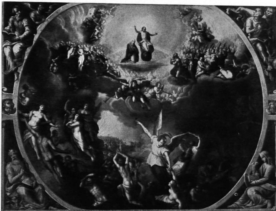
Fig. 220 Universitätsgebäude, Jüngstes Gericht, nach Chr. Schwarz (S. 142)

Gelbbraun getünchter rechteckiger Raum; an der Straßenseite fünf Fenster in tiefen Segmentbogennischen, darüber je eine ovale Fensterluke. An der anderen Seite vier hochangebrachte halbkreisförmige Oratoriumfenster und eine Öffnung gegen die Seitenkapelle; im Erdgeschoß zwei Rundbogenöffnungen mit Gittertüren gegen dieselbe. An der Eingangswand Haupttür in Segmentbogennische, neben dem Altar zwei Türen in roter Marmorlaibung mit Ohren und einem profilierten Rundbogensturz, der eine (zum Hochaltar gehörige) Glorie aus Wolken und Putten trägt, links mit vergoldeter Sonne, rechts mit Namen Mariä in Strahlenglorie. Tonnengewölbe mit jederseits fünf einspringenden Stüchtkappen; die fünf Deckenfelder enthalten je drei ovale Fresken in gemalter Lorbeerharnung. Dargestellt sind die fünfzehn Geheimnisse des Rosenkranzes.