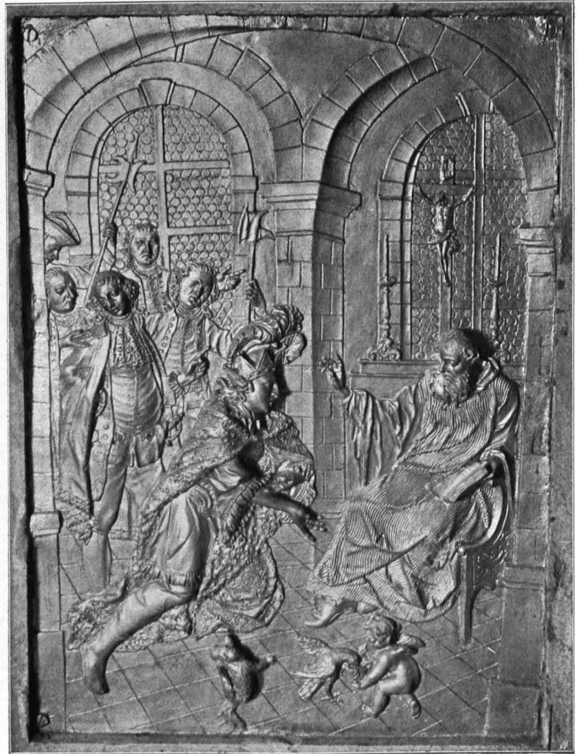
Fig. 223 Universitätsgebäude, Bleirelief am Hochaltar des Sacellum (S. 144)