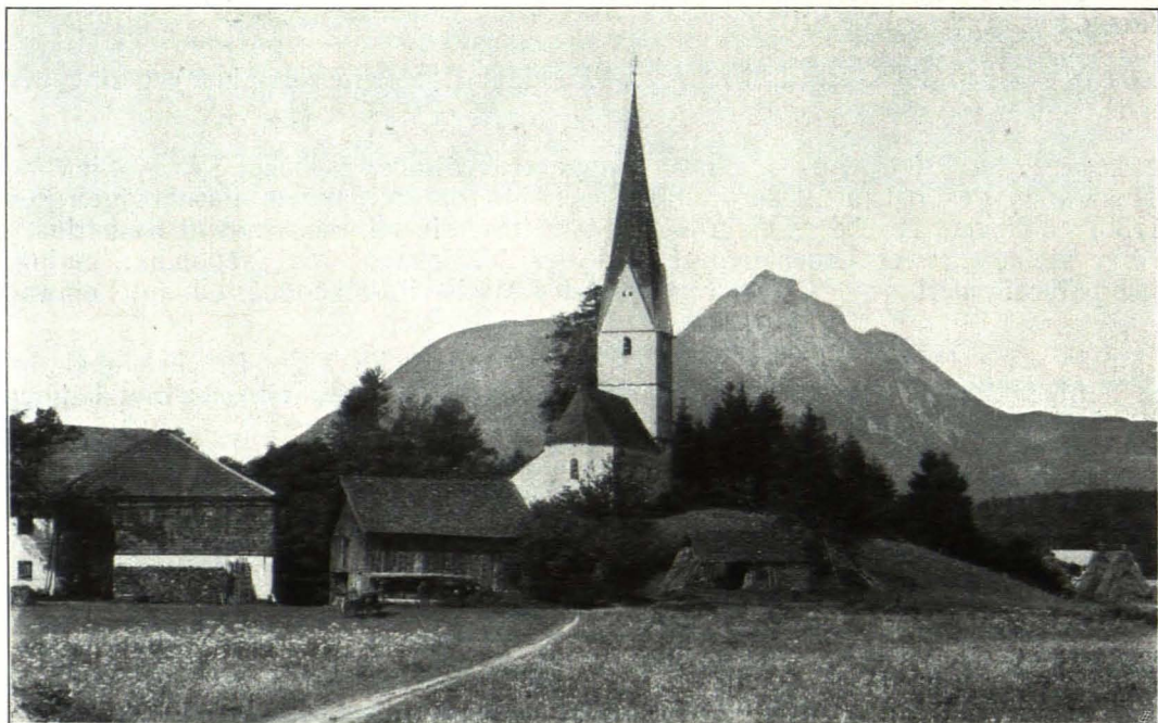
Fig. 104, Gois Filialkirche von Osten (S. 107)

proprietatis possederant , an St. Peter schenkten (a. a. O. 506, Nr. 468 c). Am 1. Mai 1465 verließ Erzbischof Burkard der St. Jakobskirche, Filiale der Pfarre Siezenheim, einen Ablass. Die Kirche hatte stets nur einen Altar; 1614 bemerkt hierzu die Visitation: Et ne ulterius imago a tergo Salvatoris excidi in-