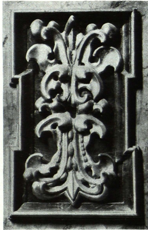
Fig. 68 Eugendorf, Pfarrkirche, Ornamentfeld vom Hochaltar, 1683 (S. 72)

mit zwei Pilastern. In den beiden Ecken Doppelpilaster. Über dem Chorrechteck flachbogiges Tonnengewölbe mit flachbogigen Gurten, über dem Abschluß Halbkuppel mit zwei Radialgurten.