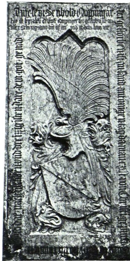
Fig. 9 Aigen, Pfarrkirche, Grabstein des Seibold Noppinger, 1437 (S. 8)