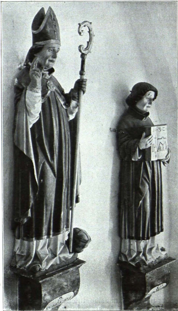
Fig. 414 Mühlberg, Filialkirche, Statuen der Hl. Rupert und Chuniald, um 1500 (S. 431)

Glocken. Glocken: 1. Kleine gotische Glocke. Umschrift: Ave maria gracia plena dominus . XV.—XVI. Jh. 2. Umschrift: Hanns Nusbickher in Salzburg goss mich A: 1681 .