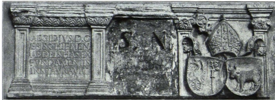
Fig. 84 Gneis, Weiherhof. Inschriftenplatte des Bischofs Ägid Rem von Chiemsee, um 1530 (S. 84)

AEGIDIVS. D. G. EPIS. CHIEMEN. AEDEIS HAS EX FVNDAMENTIS INSTAVRAVIT.